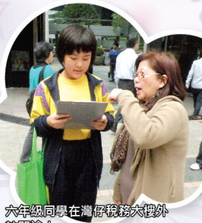
六年級同學在灣仔稅務大樓外訪問途人