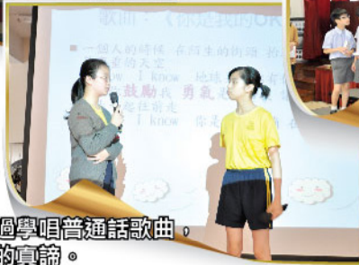
同學們透過學唱普通話歌曲，明白友誼的真諦。