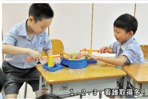
1, 2, 3, 看誰取得多!