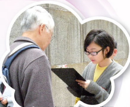
五年級同學在灣仔街頭進行訪問