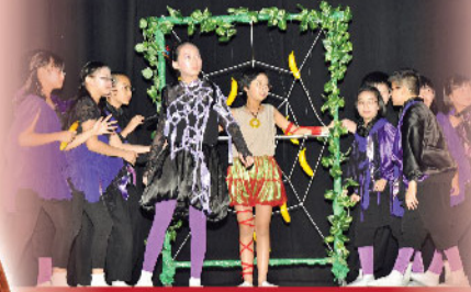
演員於綜合表演晚會施展渾身解數