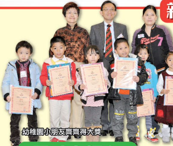
幼稚園小朋友齊齊得大獎