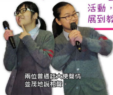
兩位普通話大使聲情並茂地說相聲。

各科組就每年學校發展重點籌畫不同形式的活動，突破學科的框架和課室的限制，讓學習延展到教室以外，擴闊學生的生活經驗。