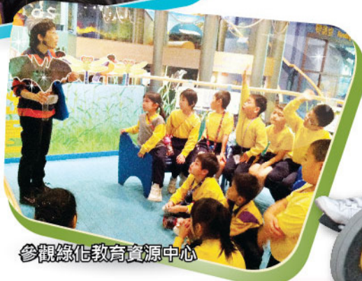
參觀綠化教育資源中心