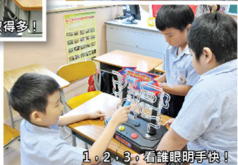
1, 2, 3, 看誰眼明手快!