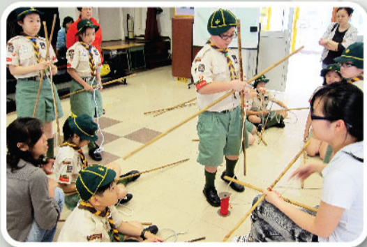
學習結繩及紮營是童軍的基本訓練