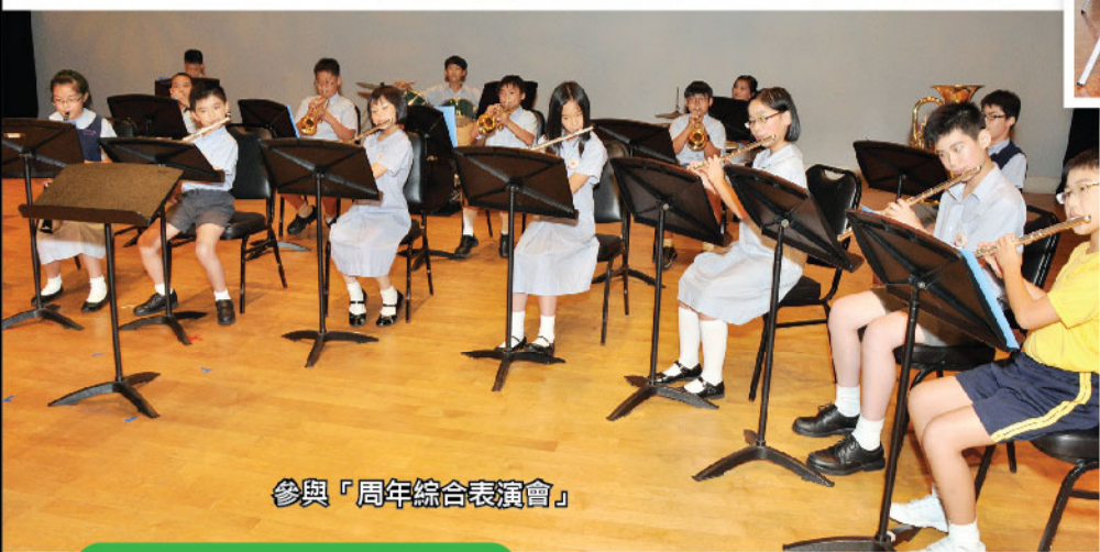
參與「周年綜合表演會」