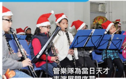
管樂隊為當日天才表演展開序幕