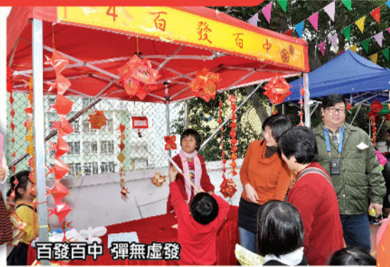
百發百中 彈無虛發