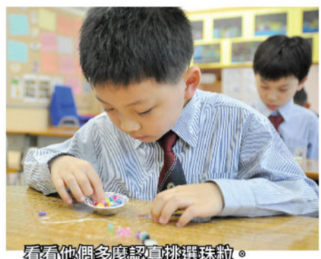
看看他們多麼認真挑選珠粒。

小小設計師讓同學發揮他們的想像力和創意。「串串小手環」讓他們學習顏色及形狀的配搭。