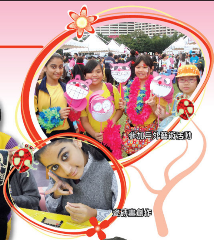
參加戶外藝術活動