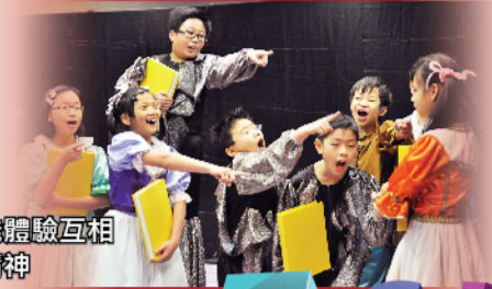
群戲能體驗互相合作精神