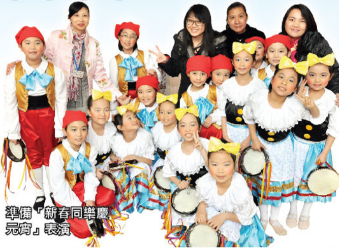
準備「新春同樂慶元宵」表演