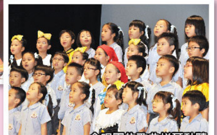
合唱團的歌曲悅耳動聽