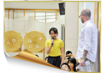
We are not shy to speak up!