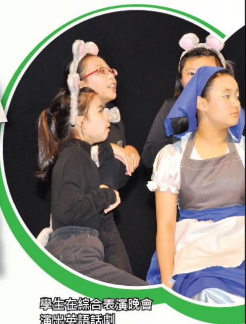
學生在綜合表演晚會演出英語話劇