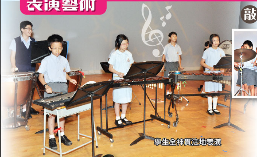
學生全神貫注地表演