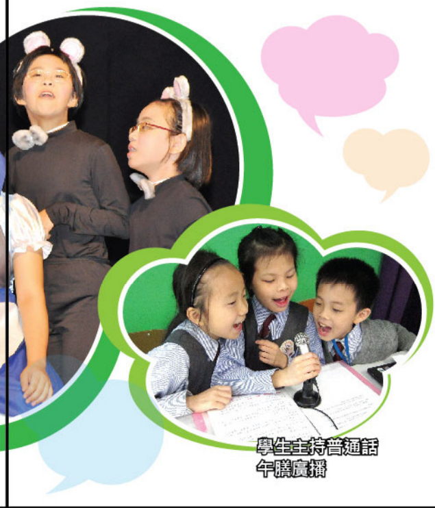
學生主持普通話午膳廣播