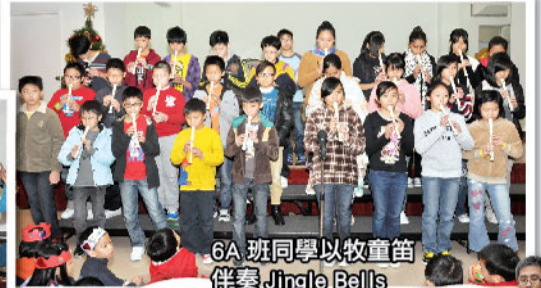
6A 班同學以牧童笛伴奏 Jingle Bells