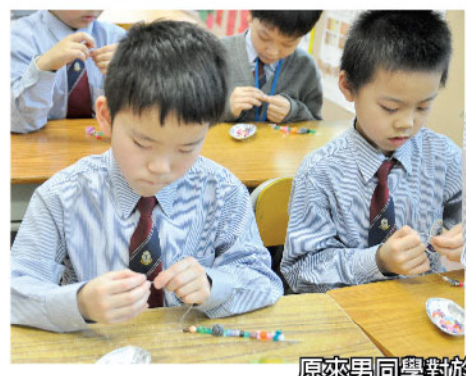
原來男同學對於小飾物的設計，心思不遜於女同學呢！