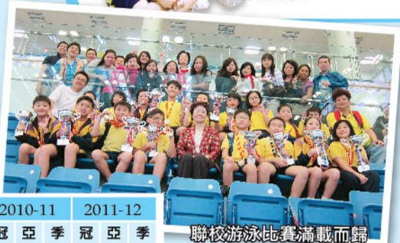
聯校游泳比賽滿載而歸