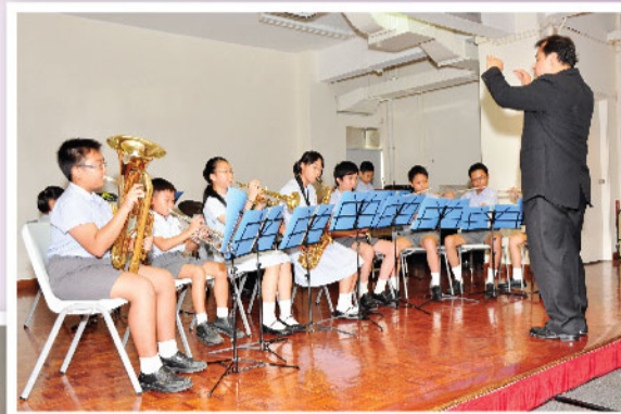
歡送「六年級」的同學 - 攝於校本畢業典禮上