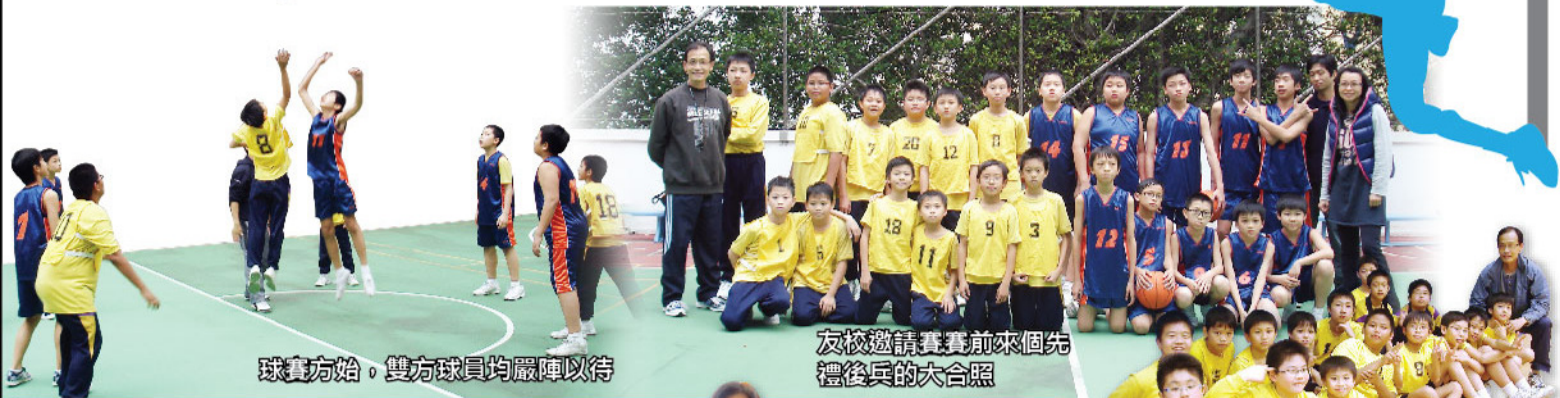
球賽方始，雙方球員均嚴陣以待