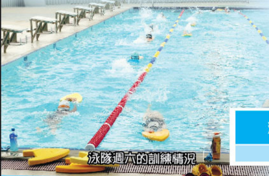
泳隊週六的訓練情況