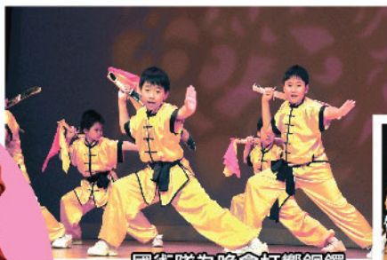
國術隊為晚會打響銅鑼