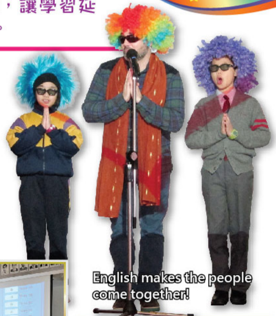
English makes the people come together!

英語早會由二十多位英語大使主持，他們肩負推動校內英語活動的使命，增加學生學習英語的興趣及運用英語的機會。