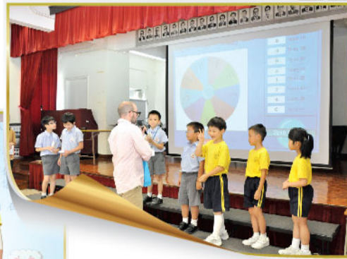
Bingo! I got it!