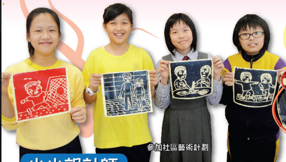
參加社區藝術計劃