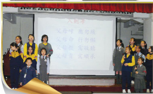
普通話大使以「孝」為主題，朗誦三字經。