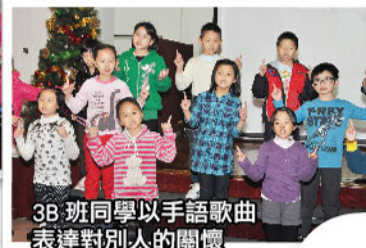
3B 班同學以手語歌曲表達對別人的關懷