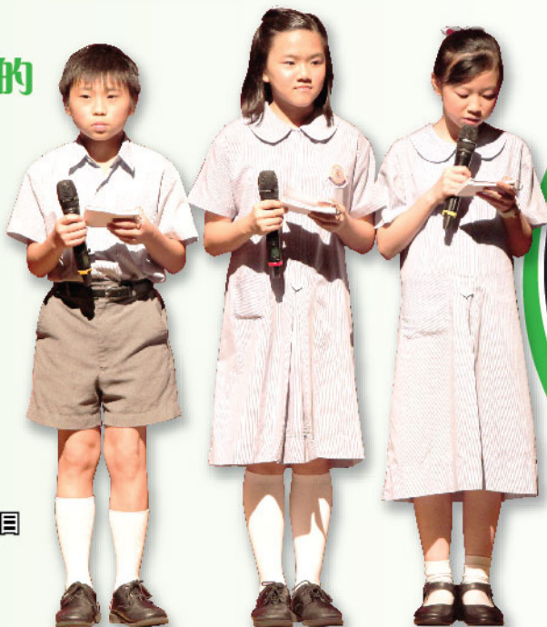
小司儀主持大型節目駕輕就熟

為了讓學生有高語文水平，本校組織了小小語言家，成員除了在大活動中擔任司儀外，更會協助老師推廣英語及普通話活動，並前往不同的幼稚園演出。