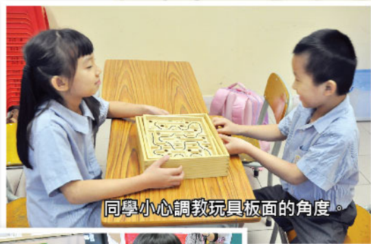
同學小心調教玩具板面的角度。