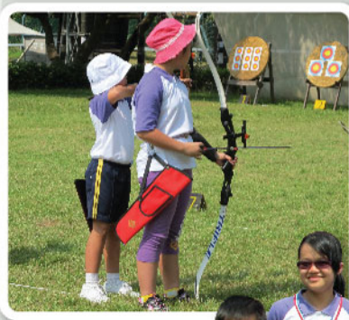
進行戶外射箭比賽