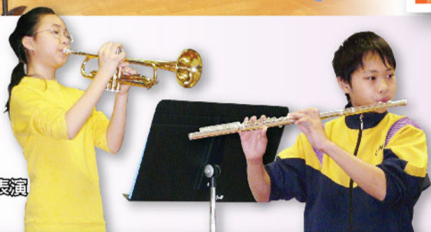
個別優秀學員獨奏表演