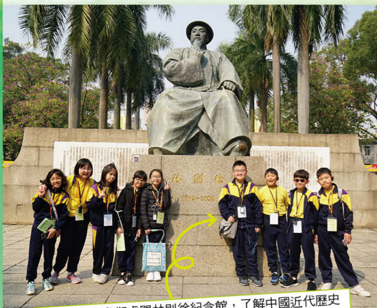
五年級學生參觀虎門林則徐紀念館，了解中國近代歷史