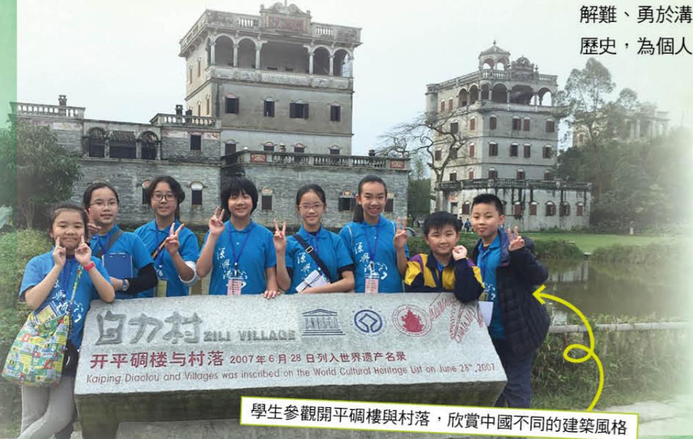
學生參觀開平碉樓與村落，欣賞中國不同的建築風格