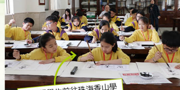
六年級學生前往珠海香山學校交流時學習書法