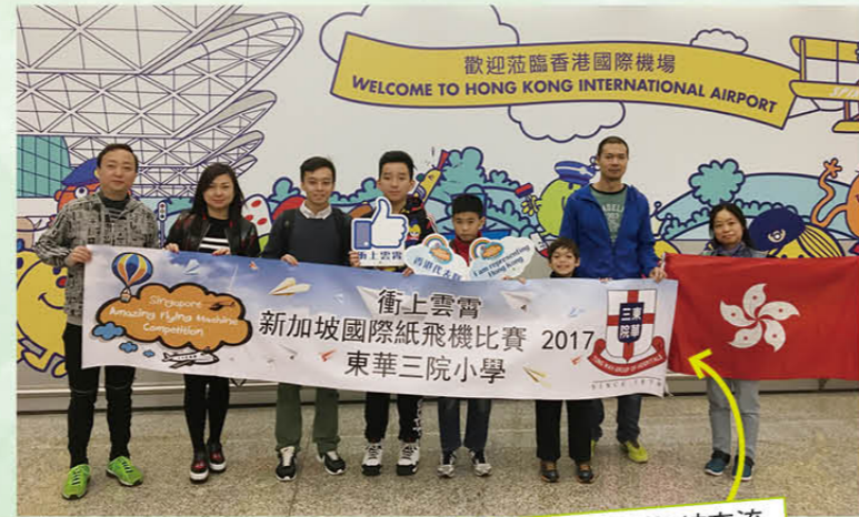
學生參加衝上雲霄計劃，前往新加坡交流