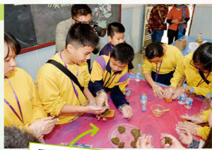
同學在石獅鎮參觀小學時，一起製作地道小食

為了拓寬視野，自2011年開始，教師曾帶領學生到海外或內地交流，拓寬視野，親身體會當地文化。近年學生曾到日本、新加坡及中國內地進行訓練及交流活動。透過文化、體育、科學探究等活動，讓學生合作解難、勇於溝通，並學會尊重不同國家文化歷史，為個人成長奠定良好基礎。