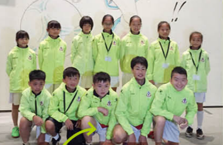
學生獲選東華三院品足球大使，認識日本足球文化