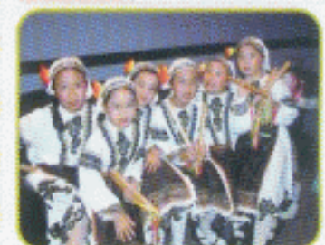
校際朗誦節比賽成績 劇名名稱: 羅馬尼亞製餅舞 獲得成績: 優等獎