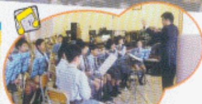
全學期各級朗誦節歌曲比賽成績 歌曲名稱: Try to Remember 獲得成績: 優異獎