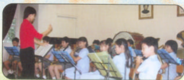
▲ 管樂隊於會員大會中表演。