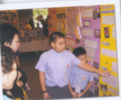
五年級學生向嘉賓介紹有關《香港旅遊全攻略》的專題展板