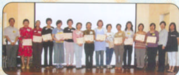
▲ 第六屆會員大會就職典禮於18/10/2003舉行。