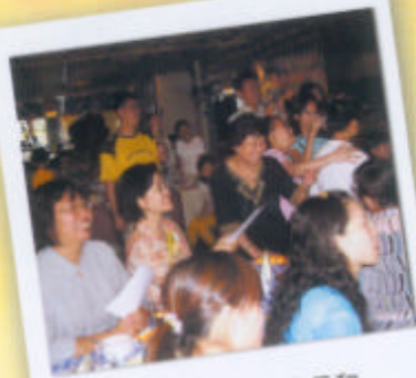
現場氣氛熱烈，家長和 老師看得津津有味。