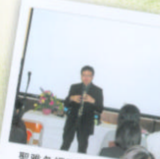
聖雅各福群會主持「利用概念圖提昇學生的學習能力」家長工作坊