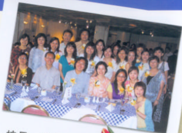
校長、老師 進行大合照。

本校謝師宴已於2004年6月26日圓滿結束，下列為當日所拍之照片及家長親筆寫作「啊！我們尊敬的老師！」的詩歌內容。