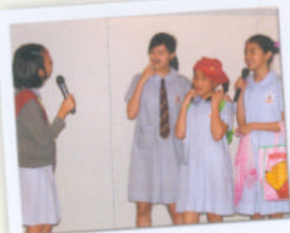
不同的組別正進行「專題研習」小組匯報