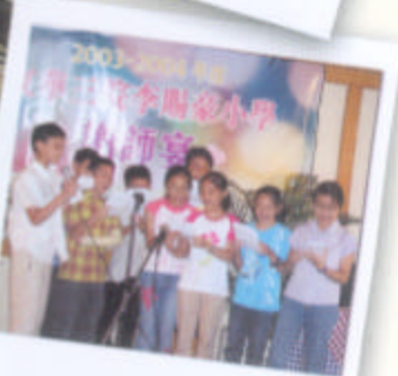
學生於謝師宴中表演唱歌

家長教師會除了舉辦活動外，還招募了一批家長義工成立「家長義工團」，他們協助看管學生午膳、整理圖書、看管放學校車隊及協助老師帶領學生參加校內及校外活動等。因得到各位家長義工的全力協助，使本校活動得以順利進行。