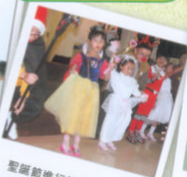
聖誕節進行親子化妝比賽