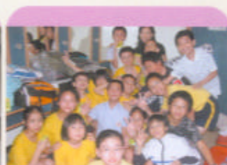
表演者前來拍張大合照 (戲劇組)