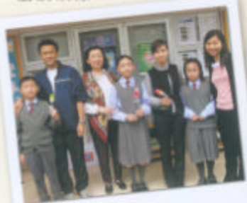
「溫馨日」 學生送上祝福給老師！

最後，本組亦舉行了不同的預防性講座以配合不同年級學生的需要，例如「預防性侵犯」、「抗逆力」、「青春期」、「升中適應」、「禁毒」、「環保」及「協助子女適應升中生活」家長講座等，藉此希望做到預防勝於治療。