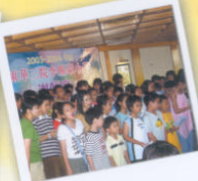
畢業生進行大合唱。