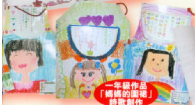
一年級作品 「媽媽的圍裙」 詩歌創作