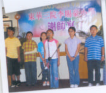
學生代表朗誦 「啊！我們尊敬的老師！」。