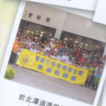
於北潭涌渡假營前拍攝大合照