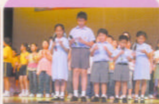
「節目完畢，多謝各位!」