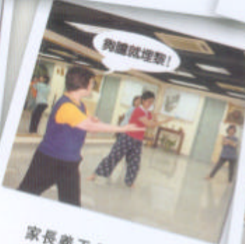
家長義工參加太極班