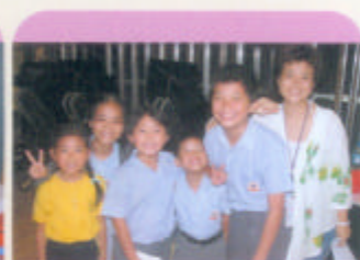
「今晚就交給我們吧！」 (四位小司儀)