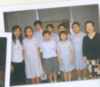
本校的少年領袖訪問 東華三院領袖。