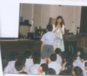
24/5「無冷氣日」 環保講座， 學生積極參與討論。