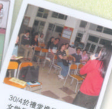
30/4於禮堂進行「跟子女做個Friend」工作坊