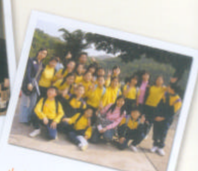
小六「自我突破挑戰日營」 大合照。