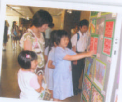
三年級的小小導賞員認真地向嘉賓介紹美術作品