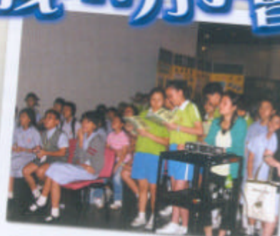
在場觀眾細心欣賞學生匯報的情形