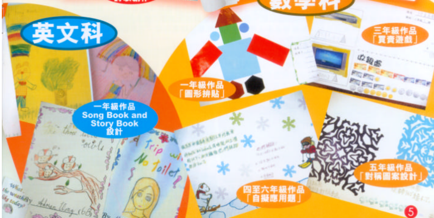
一年級作品 Song Book and Story Book 設計