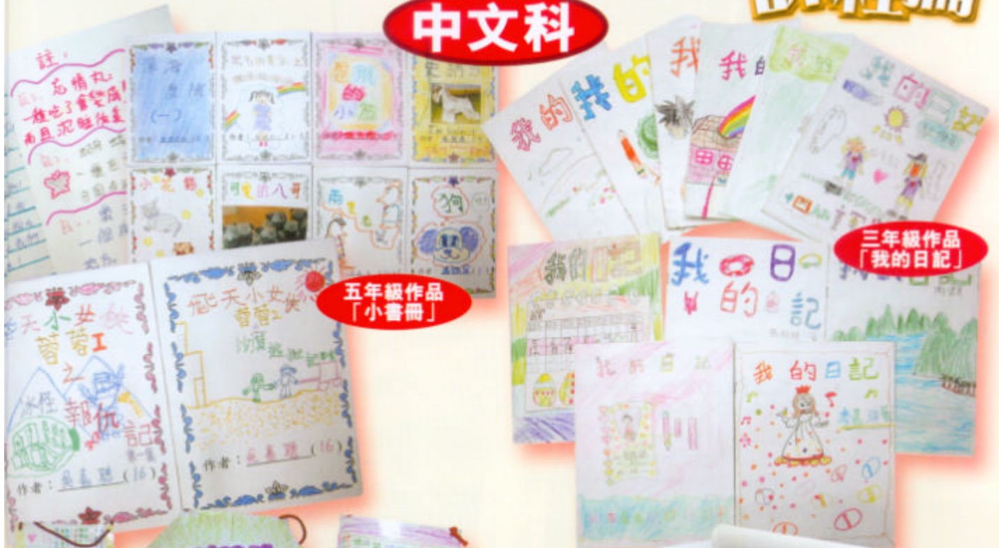
五年級作品 「小書冊」