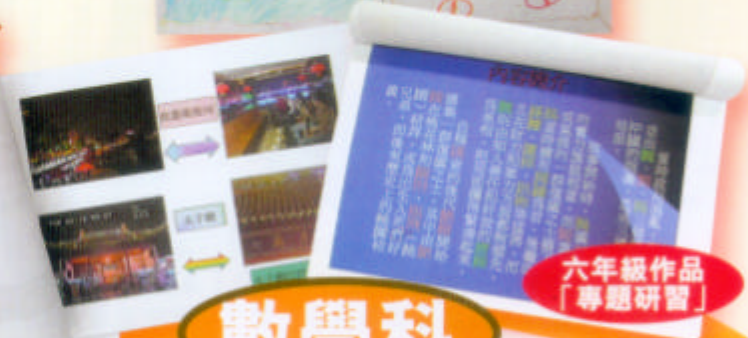
六年級作品 「專題研習」