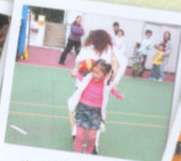
家長委員帶領進行集體遊戲，各人表現投入。