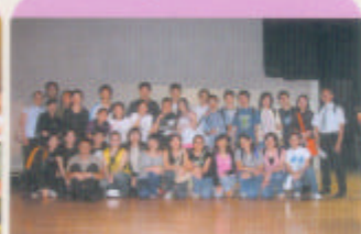
幕後工作人員進行大合照。