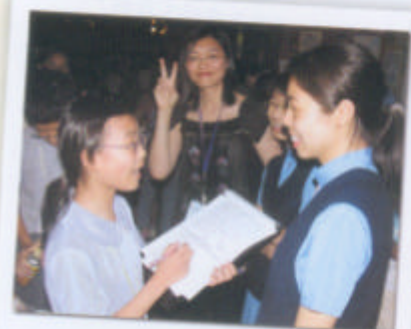
「校園小記者」向在場觀賞者訪問有關對是次展覽的感想