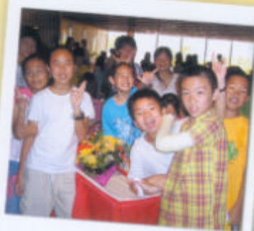
學生代表於餐廳入口處 恭候師長到來。