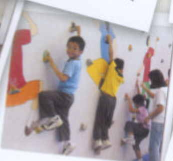
學生於渡假營內參加攀石活動