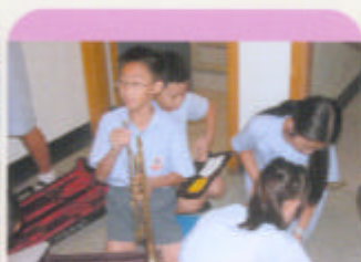
趕快把樂器預備好吧!