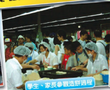
學生、家長參觀造餅過程