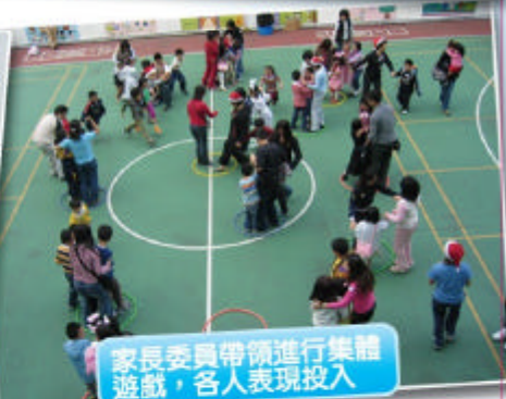
家長委員帶領進行集體遊戲，各人表現投入