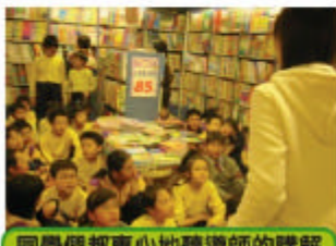
同學們都專心地聽導師的講解

為了提升同學的閱讀興趣，及認識書本的製作過程，我們參加了由螢火蟲讀書會舉辦的「閱讀社區」活動，並於3月時參觀了灣仔三聯書局。