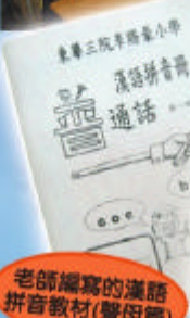
老師編寫的漢語拼音教材(聲母篇)