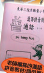
老師編寫的漢語拼音教材(韻母篇)