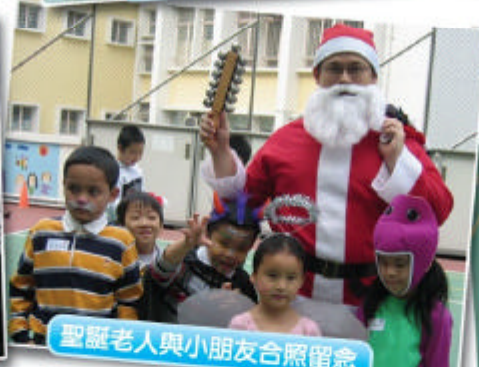
聖誕老人與小朋友合照留念