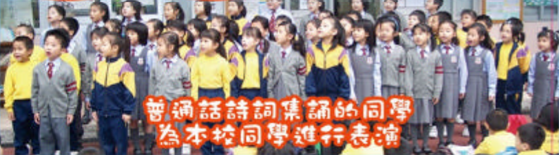
普通話詩詞集誦的同學為本校同學進行表演