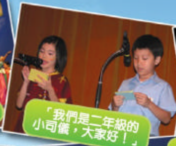
「我們是二年級的小司機，大家好！」