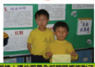
真棒！這位同學全部問題都答對了！