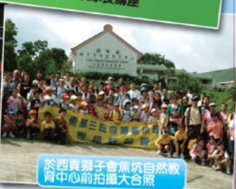
於西貢獅子會焦坑自然教育中心前拍攝大合照