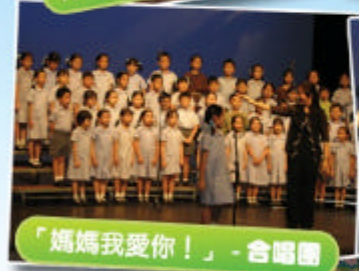
「媽媽我愛你！」- 合唱團