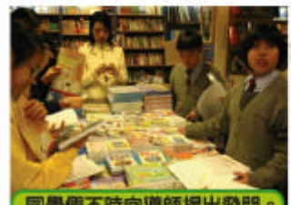
同學們不時向導師提出發問。