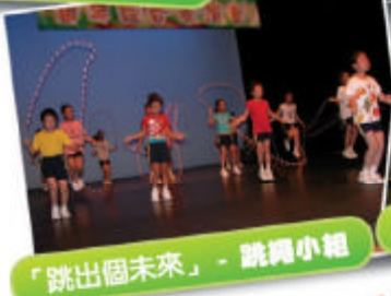
「跳出個未來」- 跳繩小組