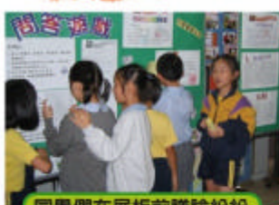
同學們在展板前議論紛紛

另外，為了配合「世界閱讀日」及慶祝安徒生誕生200周年，本校為同學籌備了一連串的活動，希望能透過不同方式宣揚閱讀的信息。活動包括：「認識安徒生問答遊戲」、「全校開心齊朗讀」、「新書展覽」、「圖書捐募」等。