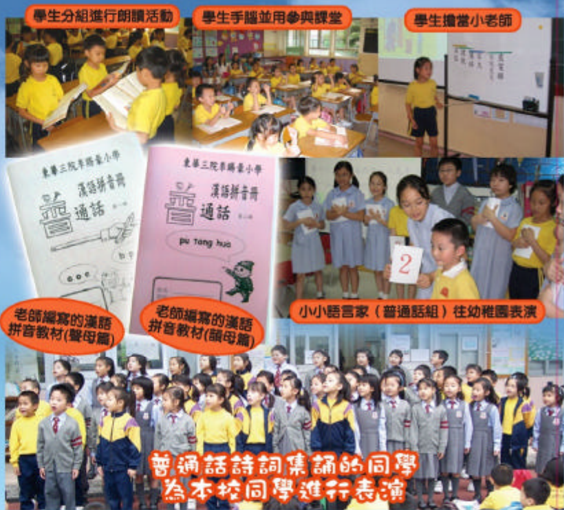
學生分組進行朗讀活動

在三年級的時候，老師更著重訓練學生的表達能力和高階思維能力，課堂上，常常會進行小組討論、匯報，師生之間的互動機會很多。為了營造最佳的語言學習環境，普通話班裡的學生也是協助老師推行普通話校外活動的骨幹成員，普通話大使、小小語言家...在零四年，第五十六屆校際朗誦節中，本校二年級的同學更獲得詩詞集誦（普通話）組別季軍。