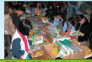
家長們也趁機為子女揀選合適的圖書

另外，為了配合「世界閱讀日」及慶祝安徒生誕生200周年，本校為同學籌備了一連串的活動，希望能透過不同方式宣揚閱讀的信息。活動包括：「認識安徒生問答遊戲」、「全校開心齊朗讀」、「新書展覽」、「圖書捐募」等。