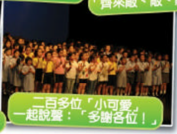
二百多位「小可愛」一起說聲：「多謝各位！」