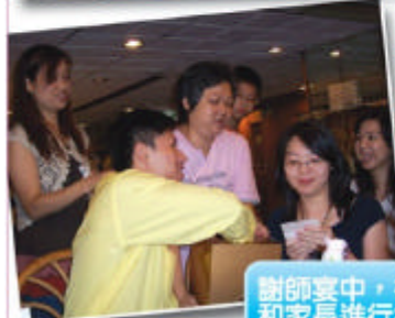
謝師宴中，校長、老師和家長進行抽獎遊戲