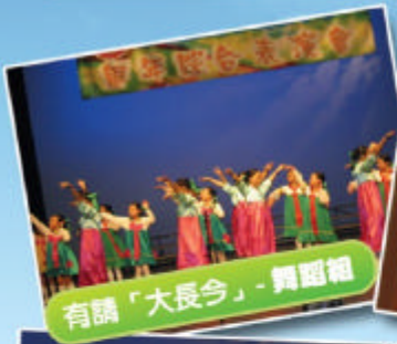
有請「大長今」- 舞蹈組

為配合本年度「高展示」的目標，本校每學年尾總會租用校外專業表演場地進行「周年綜合表演會」。這個一年一度的大型項目，除了展示學生參與課外活動一年的學習成果之外，還是提昇學生自信心的場合。學生們既緊張又認真預備他們的節目，過程中雖然有不少「酸、苦、辣」，但獲得在場的家長稱讚及欣賞，實在令每一位表演者以及訓練老師都感到興奮及嘗到辛勞後的「甜」。今年我們繼續獲得東華三院董事局支持，租用上環文娛中心舉辦是次表演會。讓我們欣賞當日的花絮：