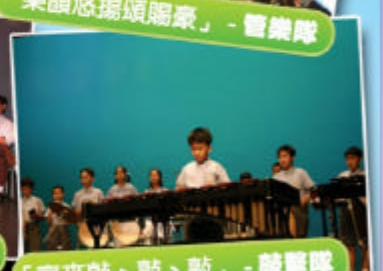
「齊來敲、敲、敲」- 敲擊隊