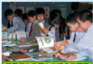
同學們在書展上表現非常踴躍

為建立學校整體的閱讀風氣，我們亦會定期舉行全校的閱讀活動。我們去年曾於11月期間舉辦書展，讓同學有更多機會閱覽不同種類的圖書。