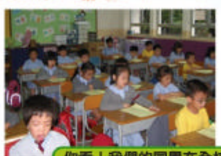
你看！我們的同學在全校朗讀日當天表現多認真！