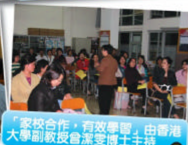
「家校合作，有效學習」由香港大學副教授曾潔雯博士主持