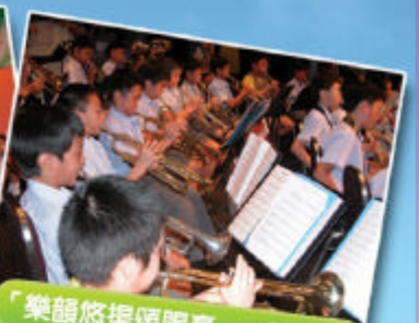
「樂韻悠揚頌賜豪」- 管樂隊