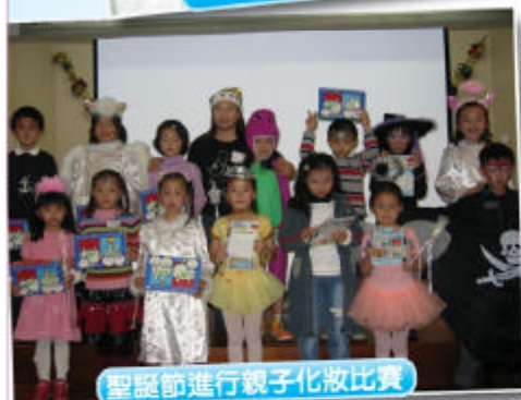
聖誕節進行親子化妝比賽