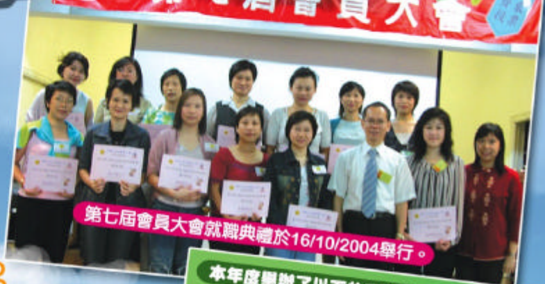
第七屆會員大會就職典禮於16/10/2004舉行。

家長教師會已成立七年，其目的是加強學校與家庭間的溝通，促進家長對學校的了解及參與學校活動和事務的興趣。本會於過往的一年，舉辦了不同的活動及工作坊，都得到家長的支持及積極參與，家長透過活動，既可與子女增進親子情，亦可向學校反映或提供寶貴意見。