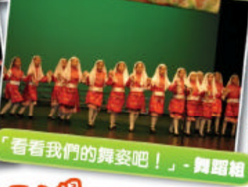
「看看我們的舞姿吧！」- 舞蹈組