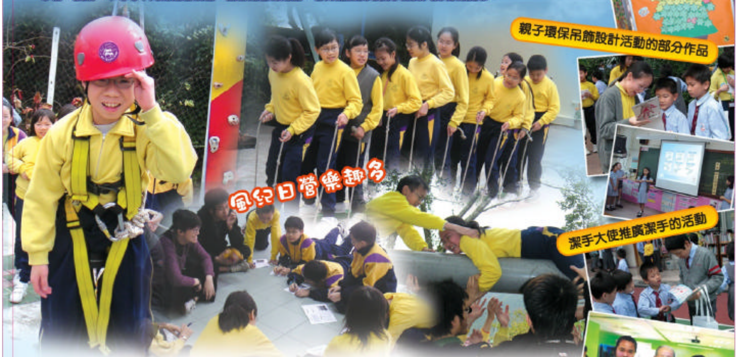
親子環保吊飾設計活動的部分作品

培育組於本年度仍不斷在訓育及德育、輔導與學生支援各方面埋首工作，以培養學生在品行德性各方面的發展和成長。於訓育及德育方面，本組除有風紀隊伍外，本年度也成立了龐大的潔手大使隊伍，以配合校內大大小小潔手活動的推行，包括潔手大使培訓、各班講座、在操場對同學的考查等等，以喚起各同學對清潔雙手、保持個人衛生的重要性。其次，「健康生活我做到」也是本組的另一發展重點。為配合發展，本組推出一系列的活動，包括承諾日、行動紀錄冊、綠色聖誕節、親子環保吊飾設計活動、大掃除活動等等，均得到同學和家長的支持及參與，令校園生活變得更健康。此外，本年度為配合「有愛心」的發展，本組推行「樂於助人乖孩子大搜尋」活動，以發揮學生互相幫助的動力，亦透過自愛、愛家庭、體諒、幫助別人、珍惜、接納、平等不同的週會綱目，配合適當的活動，著力建立及培養學生對人對物的愛心。