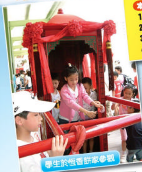
學生於恆香餅家參觀