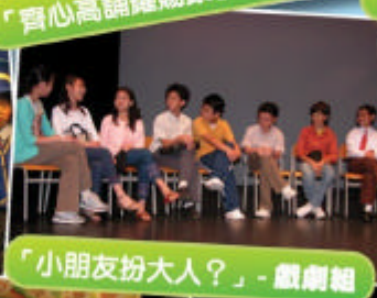
「小朋友扮大人？」- 戲劇組