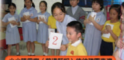
小小語言家(普通話組)往幼稚園表演