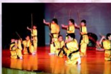
小師弟、小师妹雖然只練習了短短一年，成績也不俗。