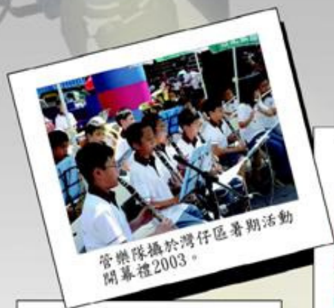
管樂隊攝於灣仔區暑期活動開幕禮2003。

為配合學校「高展示」的目標，課外活動組每年均安排及鼓勵同學參加校內外表演，展現他們不同的潛能，提升他們的自信。現在，就讓我們一起欣賞這些表演片段吧！