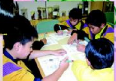
參觀完畢，環保大使填寫有關「認識植物」的工作紙。