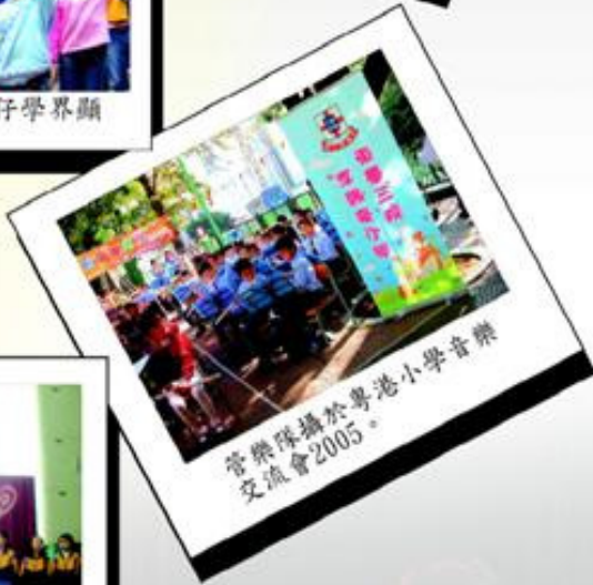
管樂隊攝於粵港小學音樂交流會2005。