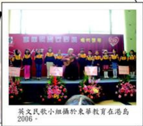
英文民歌小組攝於東華教育在港島2006。