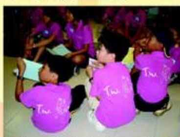
Ambassadors in the joint - school English camp.