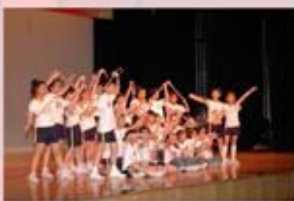
「活力小豆大合照」— 花式跳繩組。