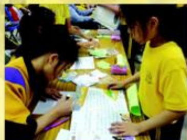
校內的學長用心地聆聽同學朗讀文章，令活動進行得非常流暢，謝謝當天協助活動的同學。