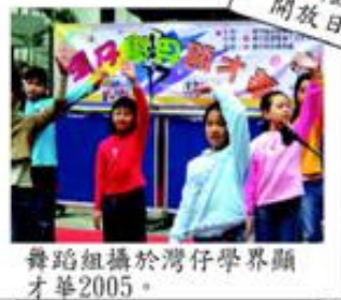
舞蹈組攝於灣仔學界顯才華2005。