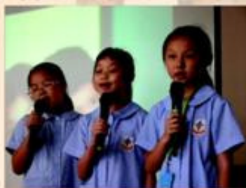
參賽者在台上施展渾身解數，一展歌喉。