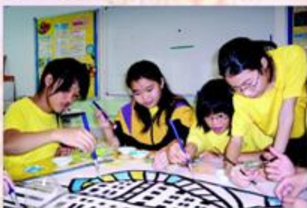
學生於視藝室內進行撕貼畫創作。