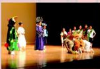
「森林高峰會議」— 戲劇組。