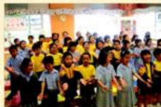
合唱團於音樂室練習。