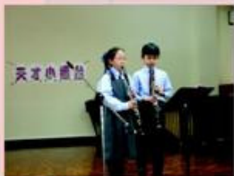
「瑪莉有隻小綿羊 r r r , m s s」