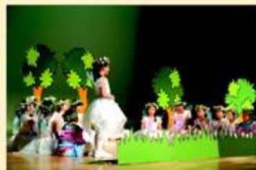
學生在周年綜合表演晚會演出的情形。