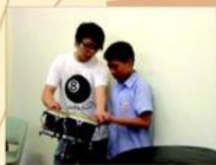
敲擊樂組學生練習的情況。