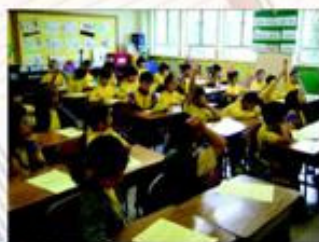
你看！同學討論時的氣氛真不錯啊！