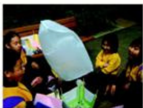
實驗結果令人興奮。