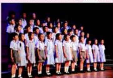
由三年級學生組成的英詩集誦於周年綜合表演會上朗誦詩歌“Autumn”。