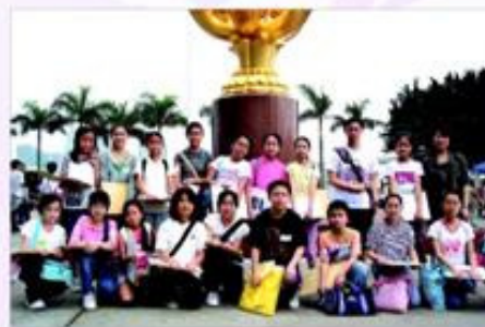
學生參加由灣仔民政事務處舉辦的寫生比賽。