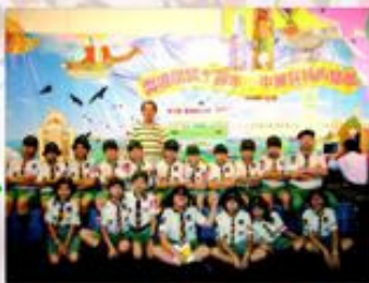
東華三院聯校小學視藝展的童軍服務。