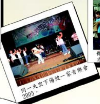
同一天空下傷健一家音樂會2005。