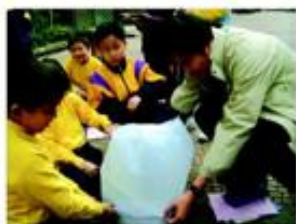
老師指導四年級學生做「孔明燈」實驗以了解空氣的特性。

我們採用探究式學習設計的常識科活動。探究式學習是以學生為中心的教學法，它能幫助學生在學習時綜合共通能力、知識和價值觀。在探究學習過程中，學生是知識的主動建構者，教師是學習的促進者。