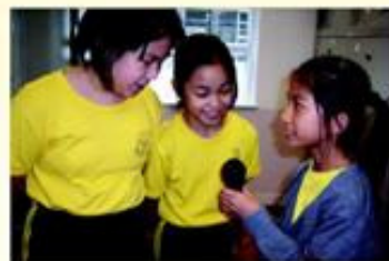
「普通話大使」正主持普通話電台。