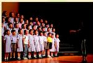
合唱團於周年綜合表演晚會中精彩的演出。