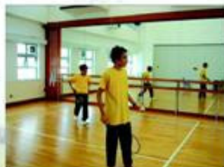
學生於校內進行羽毛球練習。