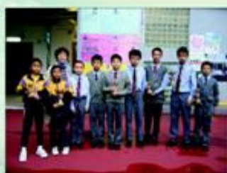
冼校長與參加西區小學校際田徑比賽獲獎的學生拍照留念。