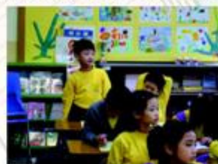
同學回答老師的提問時多認真！