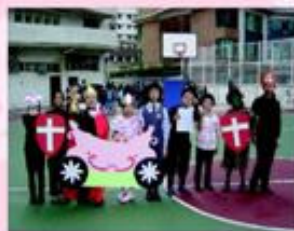
透過英語話劇，提升學生的英語表達能力。本年度英文組於校際朗誦節獲小學英文話劇組亞軍。