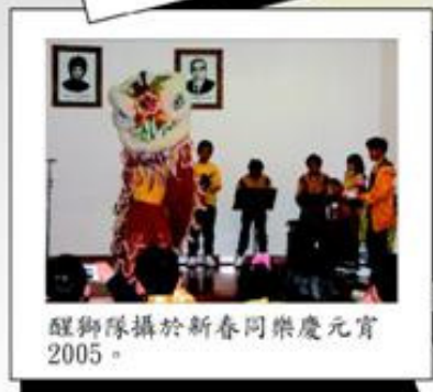
醒獅隊攝於新春同樂慶元宵2005。