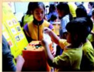
Let's have fun on Game Day!