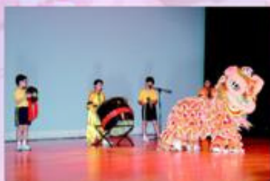
師兄們已有數年經驗，表演出色。