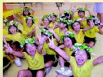
學生在輕鬆的學習氣氛下，盡情地透過唱歌和律動來表現自己。