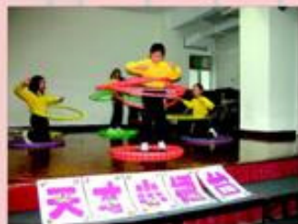
「各位觀眾，神奇呼拉圈！」