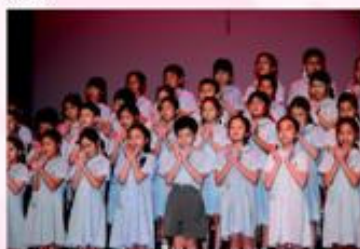
同學們聲情並茂，感情投入，想像自己是一朵盛放的花。