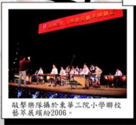
敲擊樂隊攝於東華三院小學聯校藝萃展繽紛2006。