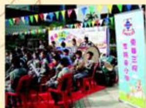
管樂隊於周年綜合表演晚會及灣仔學界顯才華2005演出的情形。