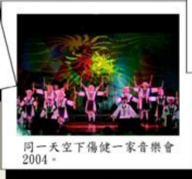
同一天空下傷健一家音樂會2004。