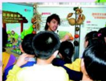
環保大使出外參觀，了解社區園圃計劃。