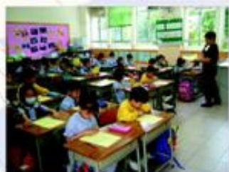
同學先跟著老師朗讀文章。

我們每年舉辦「世界閱讀日」，希望藉此推動閱讀風氣。活動當天，老師預先為同學選擇各級之閱讀篇章，並於早讀時段與學生一起朗讀文章，然後共同閱讀及進行討論。另一方面，我們亦於周內舉辦其他閱讀活動，如：書籤設計比賽、主題圖書介紹、新書推介等，以營造全校之閱讀氣氛。