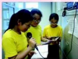
小记者逢星期三午膳時間為同學報道本港、國際資訊。