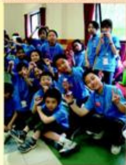
We are the champion!

為營造更佳的英語環境，及增強學生運用英語的信心，本校培訓了二十六位英語大使，他們肩負起推動校內英語活動的責任，例如主持午間廣播、設計及主持英語遊戲、話劇演出等，成為同學們的典範。