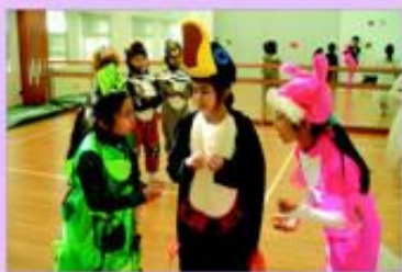
學生練排時認真投入。