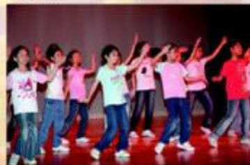
在「周年綜合表演晚會」上，舞蹈組同學表演活力十足的PARAPARA。