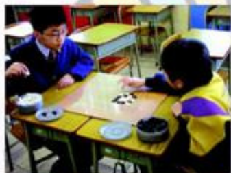
學生專注下棋的情形。