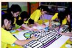
學生於校內進行撕貼畫創作。