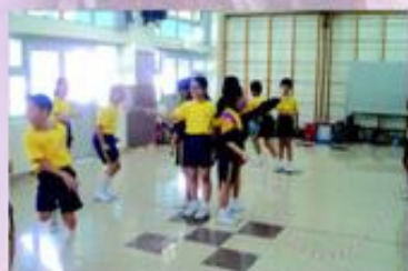
喂！快點入繩，別東張西望了。