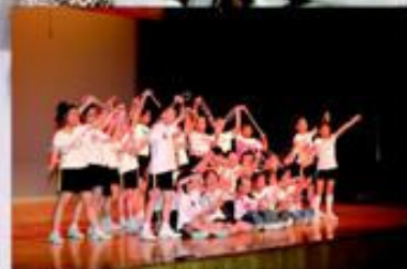
獲得大家的掌聲，一起謝幕吧！