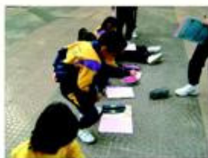
學生把結果記錄下來。