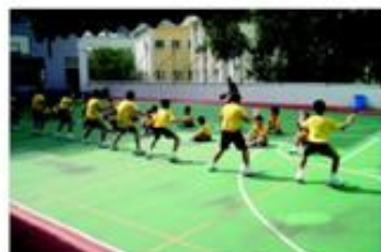
防守動作是一項消耗大量體力的練習。