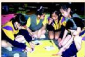
學生於合作畫會場內繼續進行撕貼畫創作。