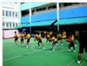
同學正努力學習「三脅勢」。