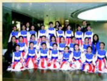
舞蹈組同學穿上以色列民族服與老師、家長一同合照。