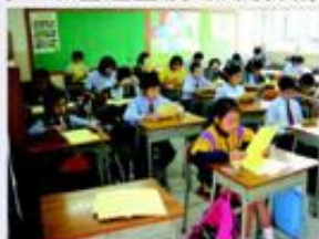
然後靜靜地閱讀文章。