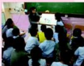
在「黃金屋時間」，小小語言家（普通話組）的同學用普通話為同學們講故事。