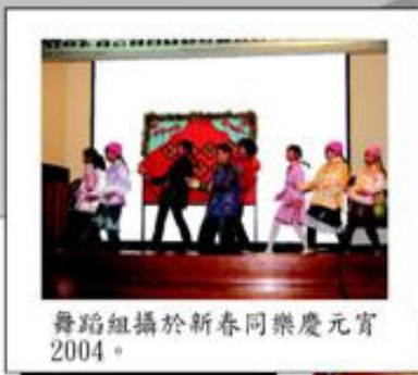
舞蹈組攝於新春同樂慶元宵2004。