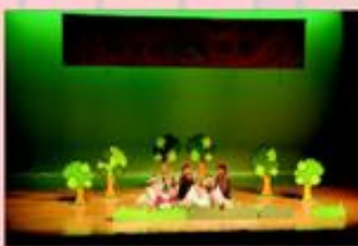
「森林花仙子」— 唱遊小組。