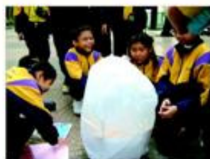
學生觀察實驗過程。