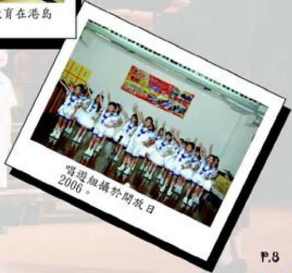
嚮遊組攝於開放日2006。