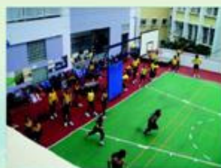
校內訓練一穿梭跑。