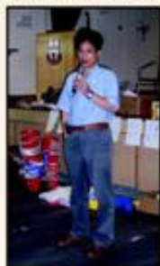
藝術家司徒乃鍾先生親臨指導本院小學生進行大型合作畫創作。

為擴展學生對藝術的視野及興趣，本校高年級同學被安排參加由東華三院小學主辦「東華三院小學聯校視覺藝術展2007」之大型合作畫活動。當天由著名的香港藝術家司徒乃鍾先生帶領本院近百名師生一同製作一幅「慶祝香港回歸十週年」的大型壁畫。本校學生能有機會參與這次活動，極具意義！