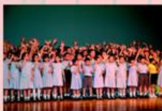
「多謝各位！」— 二百多位表演學生謝幕。