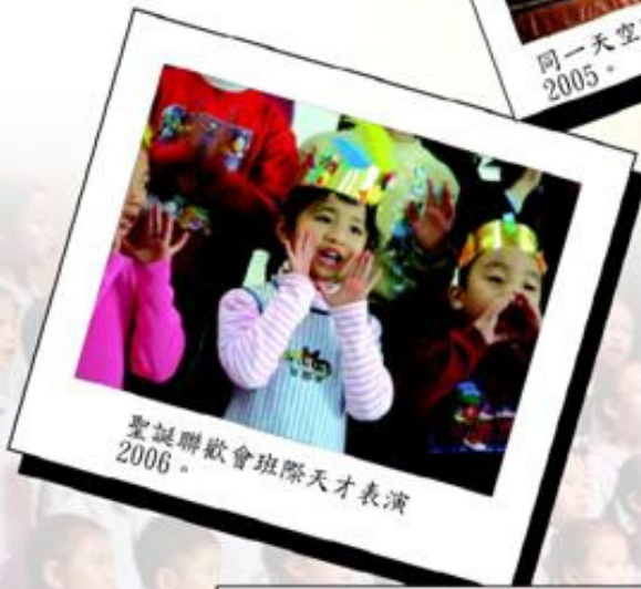
聖誕聯歡會班際天才表演2006。