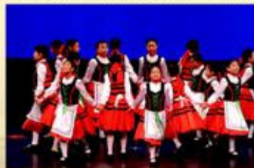
舞蹈組同學在舞蹈節上表演奧地利舞，並獲得甲級獎。