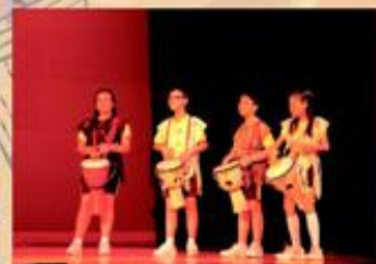
非洲鼓學員聚精會神地跟隨導師的節奏擊鼓，真是「一下」都不能錯啊！