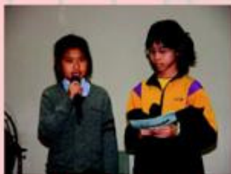
「歡迎大家來欣賞同學的表演。」