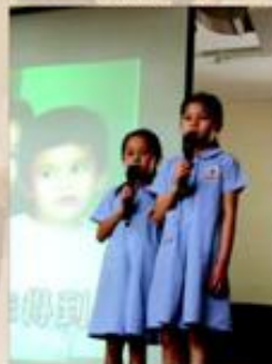
學生的歌聲繞樑三日！