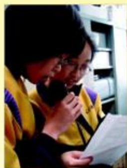
Welcome to Li Chi Ho Radio!