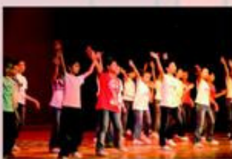
舞蹈組學員舞動全場， 活力四射。