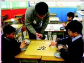
由專業的圍棋導師向學生作出悉心的指導。