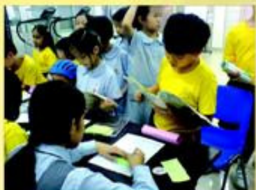
每位同學表現非常認真，怪不得達標者眾。