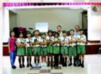
灣仔區幼童軍挑戰盾。