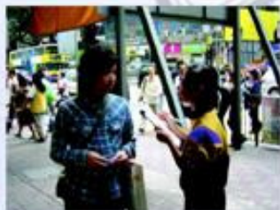
學生在灣仔區內向途人作問卷調查，了解區內的衛生情況。