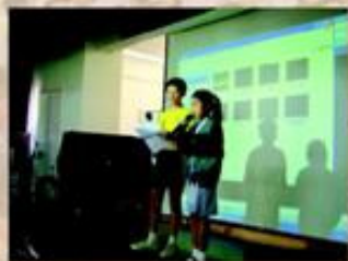
由學生擔任小司儀，介紹參賽者出場。

音樂科為了提高學生歌唱的興趣和技巧，舉辦了一個卡拉OK比賽。比賽於五月至七月午膳後小息進行，分初賽和決賽，決賽於期終試後進行。是次比賽，參加的同學十分踴躍，共35組同學參加，效果十分理想。