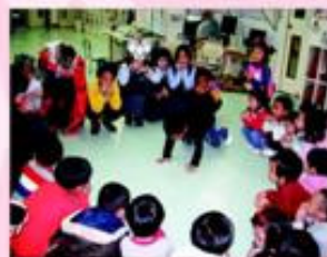
英語組服務隊與東華三院伍尚能紀念幼兒園的小朋友共渡一個快樂的下午！