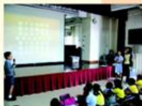
老師與「普通話大使」一起教同學唱普通話歌曲。

每逢星期三，本校設定為「普通話日」，為了營造普通話學習的語言環境，值日老師會以普通話主持早會。早會上，老師除了用普通話宣佈校園訊息外，還會與「普通話大使」一起教同學唱普通話歌曲，氣氛熱烈。午膳時，更有「普通話大使」主持普通話電台。