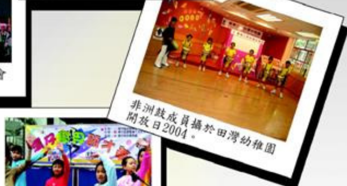
非洲鼓成員攝於田灣幼稚園開放日2004。