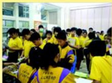
你看！朗讀周現場人頭湧湧。

朗讀是一種美讀，對於聽者而言，朗讀可以刺激他們的興趣，在情緒上與作者引起共鳴；而對於朗讀者而言，朗讀訓練可增加他們對語文的趣味，學習正確的語音、語法、語調、語氣，充分欣賞文學的美。老師透過日常的課堂，訓練學生朗讀的技巧。到五月初，學校舉行朗讀周，學生運用平日所學，朗讀指定的文章，達標者可得到一份小禮物。當天參與的同學非常踴躍和投入，達標的同學也超過九成。