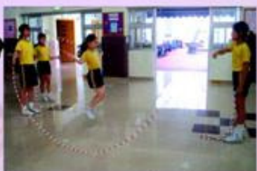
嘩！繩中有繩，好厲害啊！