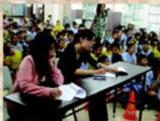
由校內的音樂科老師擔任評判。