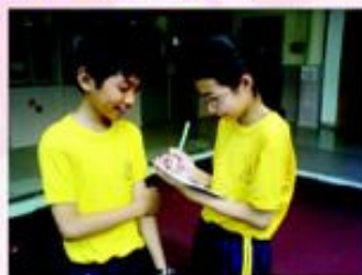
小记者採訪同學有關周年綜合表演晚會後的意見。