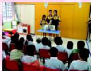
為幼稚園的小朋友表演木偶劇《灰姑娘》，小朋友們都聚精會神地欣賞。

本組透過不同的訓練活動，如講故事、話劇、擔任司儀等，提昇學生在粵語、普通話及英語方面的能力；透過出外表演及服務，提昇學生語言表達的自信心及服務他人的精神。