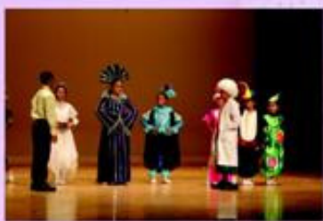
學生於周年綜合表演晚會內演出，動物戰士要保衛森林！