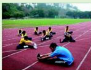
「馬拉松101運動體驗日」中，由港隊現役運動員教授田徑技巧。