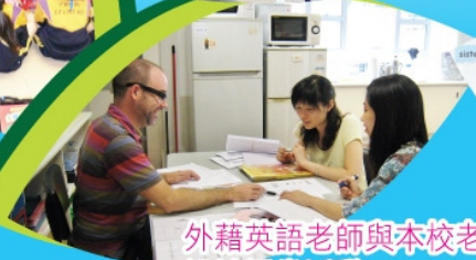
外籍英語老師與本校老師設計課堂活動