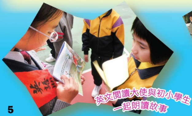
英文閱讀大使與初小學生 一起朗讀故事