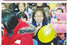
同學們在聖誕聯歡會上玩傳球遊戲，既興奮，又緊張。