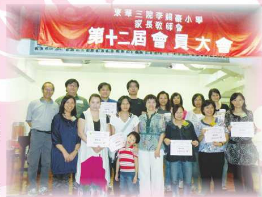
第十二屆家長教師會委員於會員大會合照。

本年度我們的工作目標是：大幅增加參與本會舉辦活動的人數。透過委員們的共同努力，過往一年，參加活動的人數非常踴躍。家教會未來會繼續精益求精，讓學生在健康的家校裏成長。