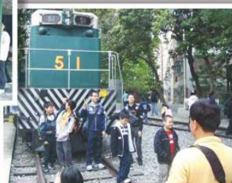
同學們難得近距離看見舊式火車頭，一定要拍照留念。