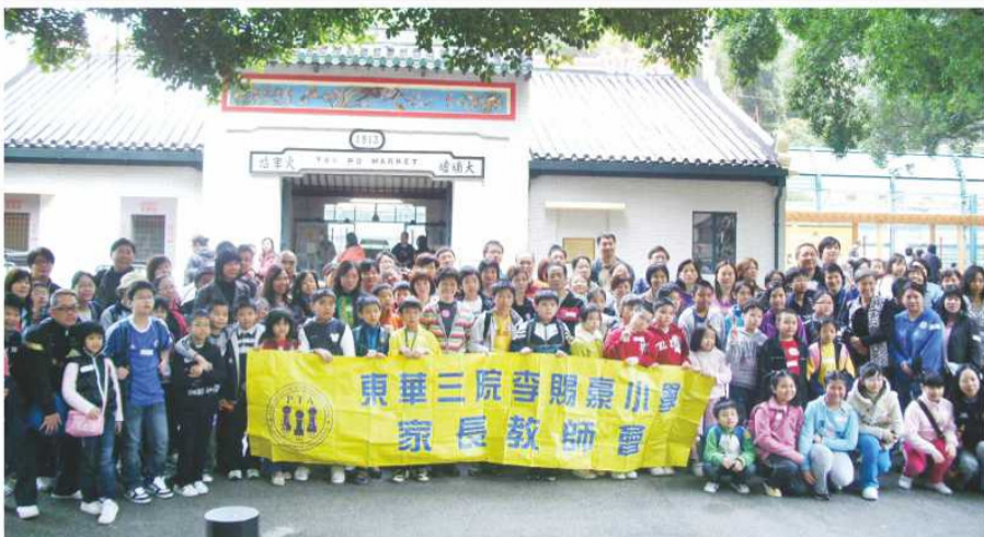
鐵路博物館前大合照！