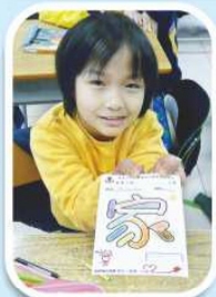
學生努力完成「愛家、愛嗎」心意咭