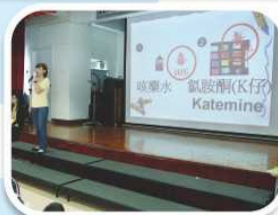
何謂毒品？參加禁毒講座讓你認清毒品的真面目