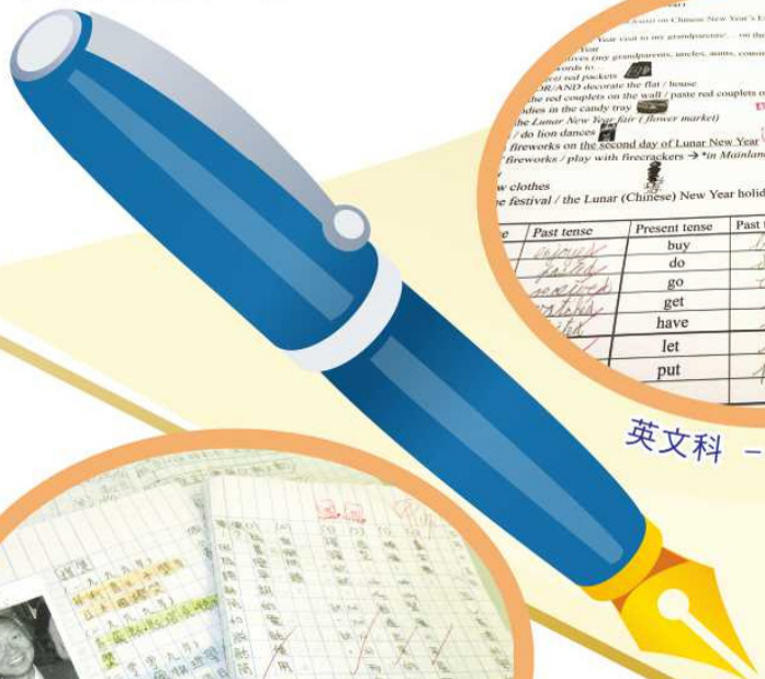
英文科 - Notebook