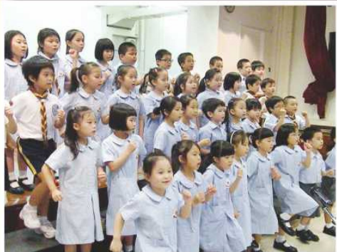
合唱團同學於會員大會上表演，歌聲繞樑三日！