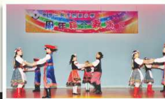
西方舞組再次在台上表演學校舞蹈節得獎舞蹈《波蘭勇士舞》。