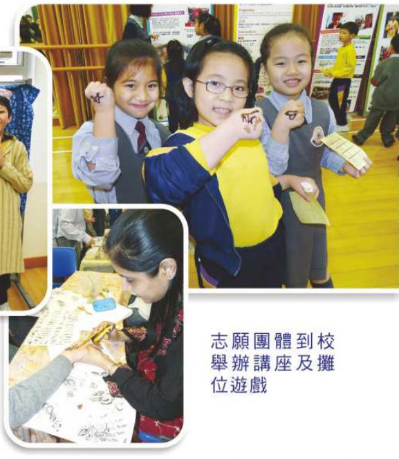
志願團體到校舉辦講座及攤位遊戲

領袖生 既是老師的「好幫手」，又是同學的好榜樣，我們十分重視領袖生的培訓。本年度，我們透過一系列領導才能的培訓課程，提升領袖生的領導能力，從而學會有效協助同學遵守紀律及替同學解決難題。