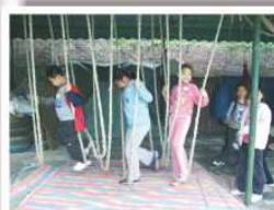
同學們都小心翼翼地跨過繩陣，看誰最快到達終點？