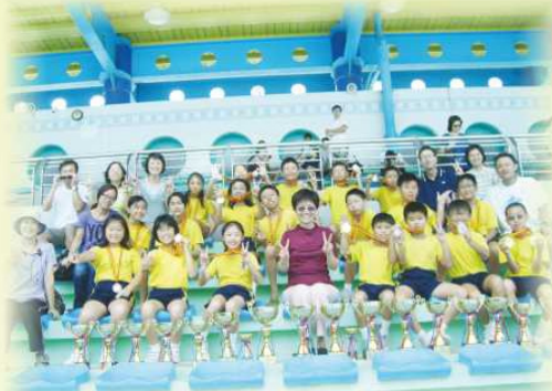
聯校游泳比賽再創佳績！

比賽方面，本年度共有180名學生（佔全校人數的48%）參加校外比賽，學生於校際朗誦節、校際舞蹈節、校際音樂節、東華三院小學聯校運動會及水運會、學界港島西區運動會、水運會及射箭等比賽中獲取了不計其數的獎項，成績彪炳。