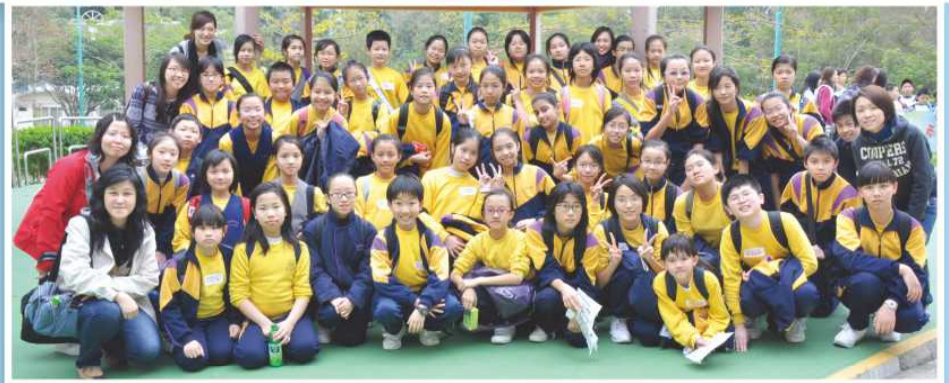
領袖生到西貢戶外康樂中心參加訓練日營

領袖生 既是老師的「好幫手」，又是同學的好榜樣，我們十分重視領袖生的培訓。本年度，我們透過一系列領導才能的培訓課程，提升領袖生的領導能力，從而學會有效協助同學遵守紀律及替同學解決難題。