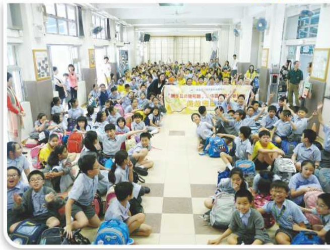
「攜手互助建和諧」長幼齊講故事