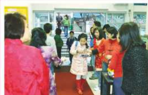
家教會委員於農曆新年假後第一天開學早上，在禮堂派發賀年糖果。