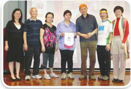
冼校長代表學校致送錦旗給長者義工及講者