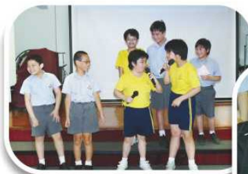
參與「成長的天空」的同學主持「友共情歌曲點唱」