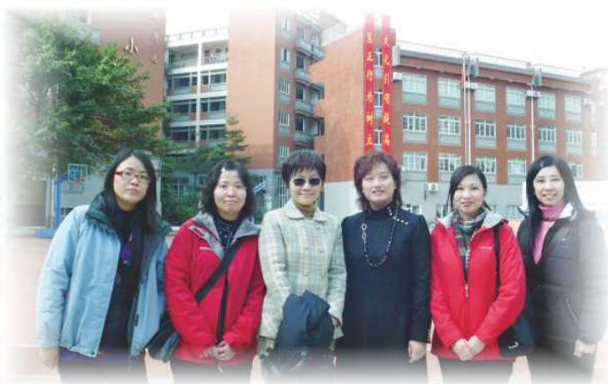
與探訪學校校長拍照留念

為讓教師團隊與時並進，掌握教學方法的最新發展，學校除鼓勵教師因應個人的興趣和需要參加大專院校的專業進修課程外，更配合學校發展需要，定期舉辦專業發展活動。去年本校舉辦的活動包括：「言語治療」及「自閉症與亞氏保加症的認識」講座、「海洋公園學院-環境教育」活動、「英文寫作教學」工作坊、數碼港弘立書院「英文教學交流」等。此外，校長和四位教師更在聖誕及新年假期參加「東華三院聯校教師專業評課學習團」，到廣州進行教學交流活動。