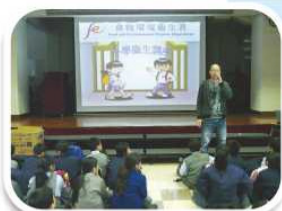
食物環境衛生署舉辦小學衛生講座