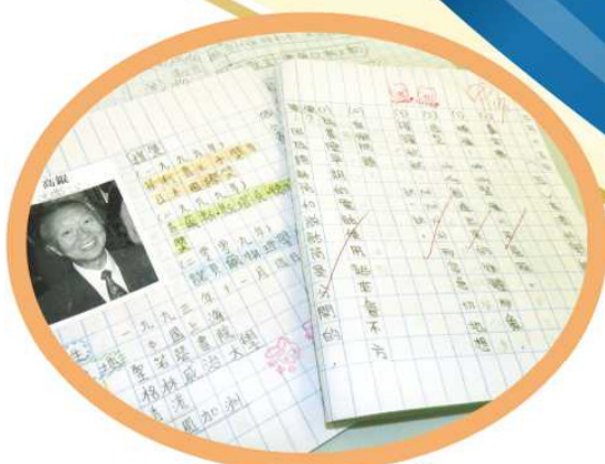
中文科 - 預習簿