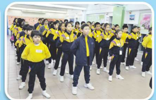
領袖精神：律己助人、以身作則、服務同群