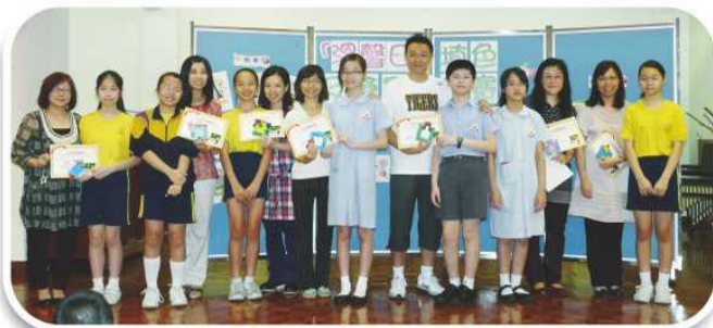
學生致送敬師咭及自製禮物給全校教師及職員