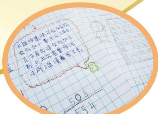
數學科 - 筆記簿