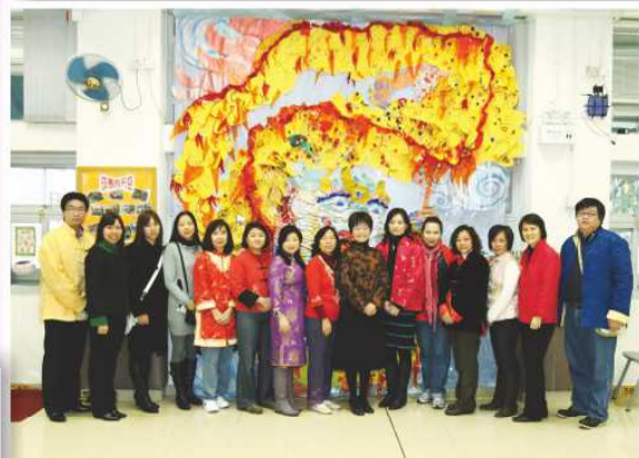
校長、老師和家教會委員與「龍」合照！