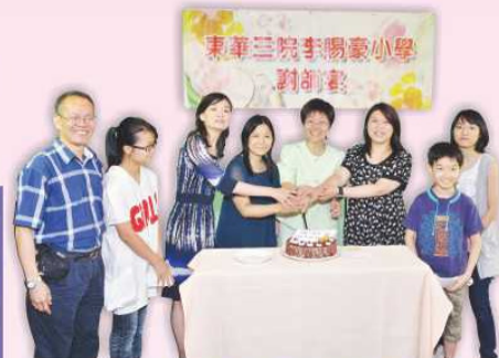
冼校長和六年級班主任於謝師宴上一起切蛋糕。