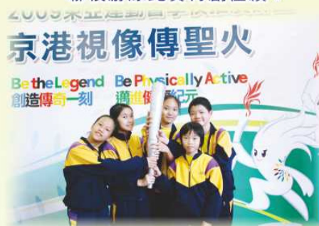
本校田徑隊代表出席京港視像傳遞聖火活動。

比賽方面，本年度共有180名學生（佔全校人數的48%）參加校外比賽，學生於校際朗誦節、校際舞蹈節、校際音樂節、東華三院小學聯校運動會及水運會、學界港島西區運動會、水運會及射箭等比賽中獲取了不計其數的獎項，成績彪炳。