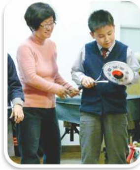
一班熱心的長者義工到校示範各種運動的方式