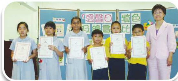
「溫馨日」填色及繪畫比賽校長頒發獎狀給四年級得獎學生