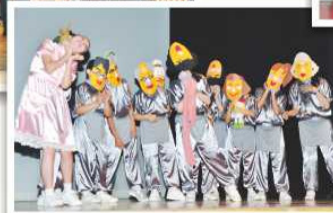
當晚戲劇組表演的故事發人深省，令人笑中帶淚。