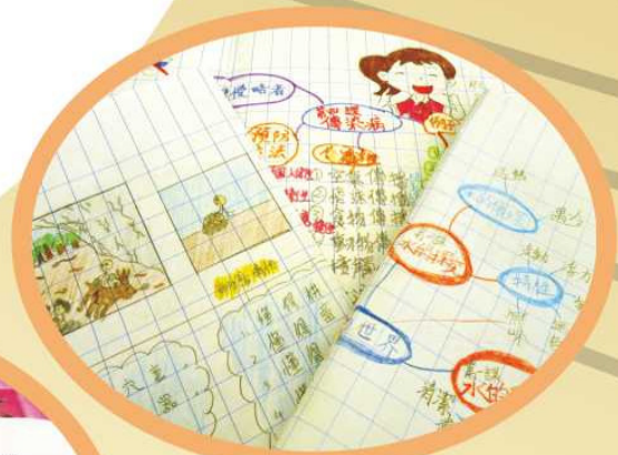
常識科 - 筆記簿

「學習有方法」是學校整體教學策略，老師指導學生運用「六何法」自擬問題、以圖表組織或分析課文等方法進行預習，引導學生做學習筆記，讓學生有系統地整理學習內容，並掌握自學方法，為未來學習打好基礎。