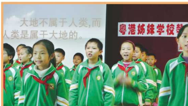
一節精彩的中文課