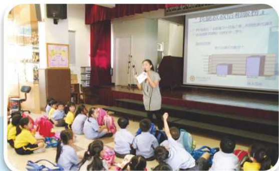
社區機構派員到校教導學生保護自己的方法