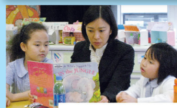
能跟自己的好友一起閱讀，是一件樂事！