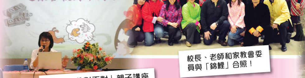
校長、老師和家教會委員與「錦鯉」合照！