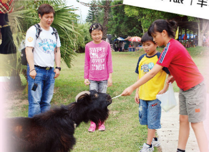
學生在錦田鄉村俱樂部齊齊餵「羊羊」。