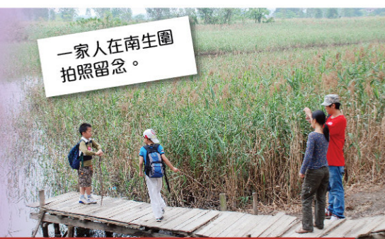
一家人在南生圍拍照留念。