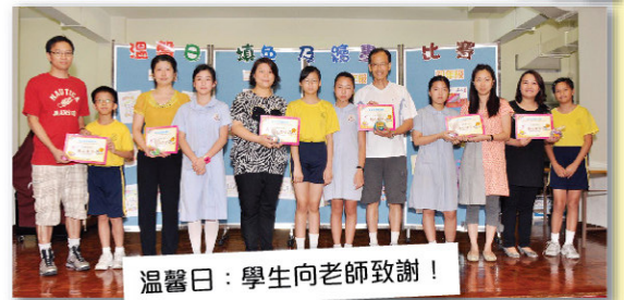
溫馨日：學生向老師致謝！