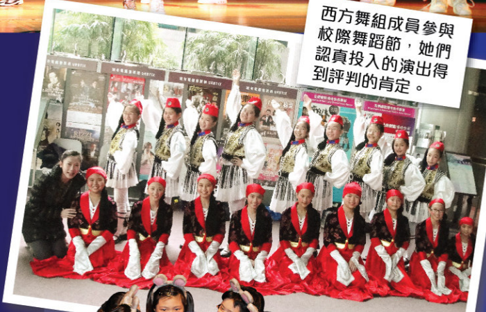
西方舞組成員參與校際舞蹈節，她們認真投入的演出得到評判的肯定。

本校推行一生一體藝政策，期望學生能夠選擇一項體育或一項藝術項目作長期發展。根據學生課外活動紀錄，去年共有95%學生參加一項或以上的課外活動。比賽方面，本年度共有212名學生(佔全校人數61%)於去年參加校外比賽。學生於校際朗誦節、校際舞蹈節、校際音樂節、東華三院小學聯校運動會及水運會、學界港島西區運動會、水運會及射箭等比賽中獲取不少獎項。