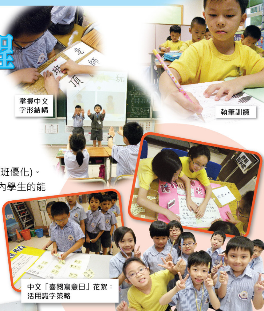
掌握中文 字形結構