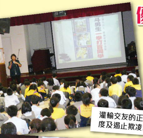
灌輸交友的正確態度及遏止欺凌講座

培育組統籌健康校園的工作，並與家教會家長執委成員合力推行，初步檢視了校內促進健康的發展情況，包括：健康學校政策、學校環境、校風與人際關係、健康生活技能與實踐、家校與社區聯繫及學校保健與健康促進服務。本年更成功申請為2011至2012年優質教育基金健康校園網絡計劃的夥伴學校。