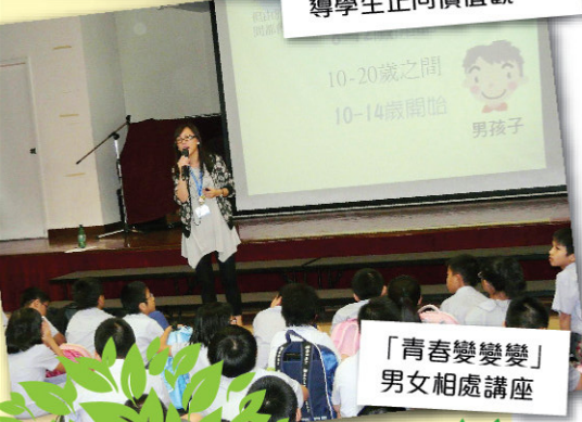
「青春變變變」男女相處講座