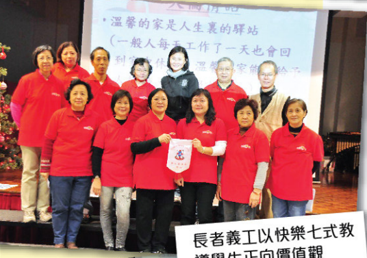
長者義工以快樂七式教導學生正向價值觀

根據健康校園基線需求評估的「持分者意見調查」統計結果顯示：學校的不同持分者，包括教師、家長、非教學職員及學生之間維繫著和諧的人際關係。以下為獲得評分最高的表現：