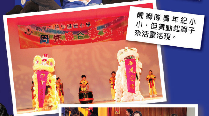
醒獅隊員年紀小小，但舞動起獅子來活靈活現。

為增加學生自信心及展現體藝才華，學校每年租用專業表演場地舉行周年綜合表演會。本年度於香港理工大學賽馬會綜藝館舉行，參加表演學生185名(佔全校學生人數54%)，出席觀眾三百多位，場面熱鬧。當晚各同學都傾力演出，他們投入及認真的態度，給觀眾留下深刻印象。