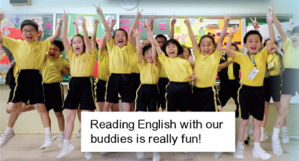
Reading English with our buddies is really fun!