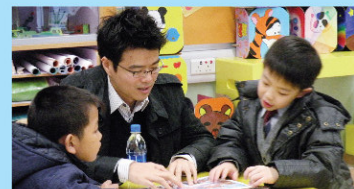
伴讀叔叔和姨姨的英語發音很地道，是我們學好英文的榜樣！