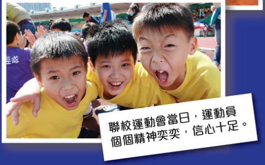
聯校運動會當日，運動員個個精神奕奕，信心十足。