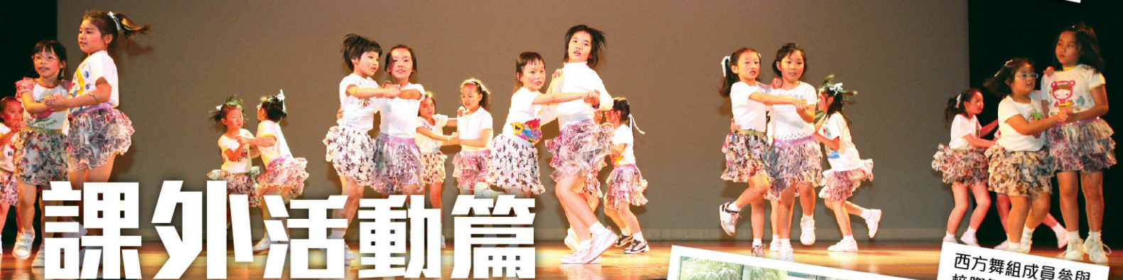
西方舞隊員默契十足，跳起舞來活潑可愛。