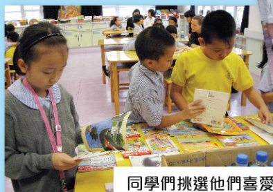
同學們挑選他們喜愛而又配合他們閱讀程度的英文書。

義工隊伍為我們的初小學生進行英文伴讀計劃。逢週二午飯後，「麥格理集團基金會」義工隊伍到本校與二年級的學生一起閱讀英文書。每節三十分鐘的閱讀時間，同學們挑選自己喜愛而又配合他們閱讀程度的英文書與義工叔叔/姨姨分享。經過八個月的伴讀計劃，義工隊伍喜見同學們能自信地朗讀書本內容，同學們亦表示計劃能使他們多認生字及朗讀流暢。學期末的慶祝會上，同學們除獲頒發證書外，他們還獲麥格理集團基金會送贈一本英文圖書，以茲鼓勵。