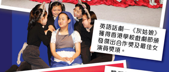
英語話劇—《灰姑娘》獲得香港學校戲劇節頒發傑出合作獎及最佳女演員獎項。

為增加學生自信心及展現體藝才華，學校每年租用專業表演場地舉行周年綜合表演會。本年度於香港理工大學賽馬會綜藝館舉行，參加表演學生185名(佔全校學生人數54%)，出席觀眾三百多位，場面熱鬧。當晚各同學都傾力演出，他們投入及認真的態度，給觀眾留下深刻印象。