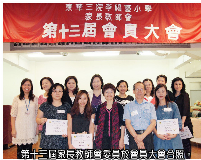
第十三屆家長教師會委員於會員大會合照。