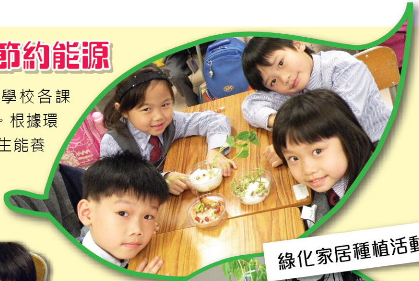
綠化家居種植活動

環保大使每天小息及午膳時間巡查學校各課室，確保所有學生離開課室前能關掉電源。根據環保大使監察各班節約能源紀錄表，80%學生能養成離開課室前關掉電源的習慣。