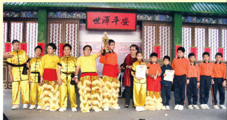
▲ 醒獅隊隊員高舉優勝獎杯，見證佳績