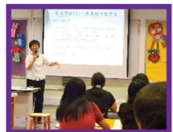
▲ 家長教育系列—愛的教育