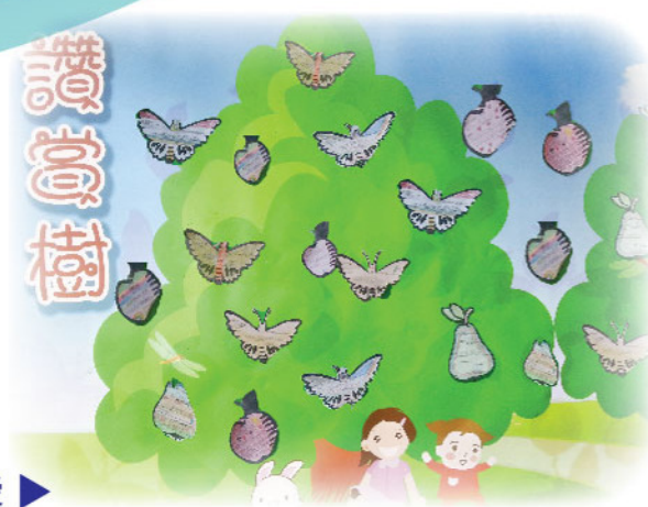
「讚賞樹」—充滿同學的欣賞與愛

視藝科在各班課室門外製作「讚賞樹」，同學填寫讚賞咭後，把欣賞同學的名字及讚賞語句寫在讚賞卡上，然後掛在讚賞樹上。透過此活動，讓學生懂得欣賞別人的長處及優點，學會如何向別人表達欣賞及謝意，同時亦提升學生的自尊感與自豪感。