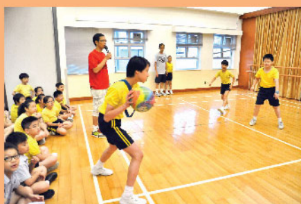
▲ 學生在活動中心進行閃避球比賽

小息期間，禮堂設跳繩區及呼拉圈區，讓學生進行運動。課前設有健康加油站，在操場、百周年紀念廣場、學生活動中心等地方，提供跳繩、呼拉圈、健康舞、羽毛球、緩步跑及籃球等體育活動，進一步推廣運動訊息，成為活力校園。