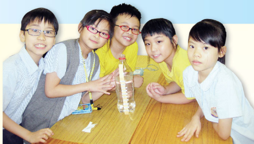
▲ 分組製作量度器皿

習能力的學生。此外，課堂中，透過不同層次的提問、師生和生生互動，讓學生從做中學，提高每個學生的參與率。此外，教師更會適時調節教學進度及策略，切合學生的學習需要。