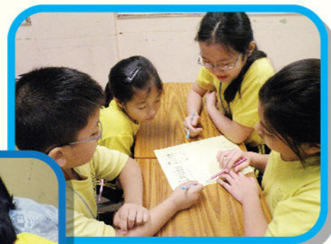
▲ 'What did you eat last night?'