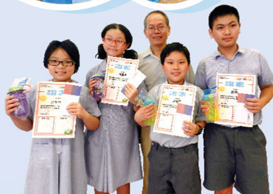
▲ 「至叻有營人計畫」 獲得金獎的同學