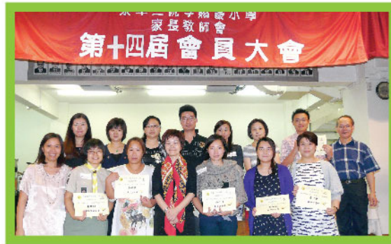
第十四屆家長教師會委員合照。

家長教師會踏入第十五 年。過往一年，本會舉辦各項 活動，除了本校學生和家長參 加外，還邀請校外幼稚園及小 學家長一同參與，分享精彩的 講座內容，互相交流教育子女 心得，各項活動的參與人數相 當踴躍。