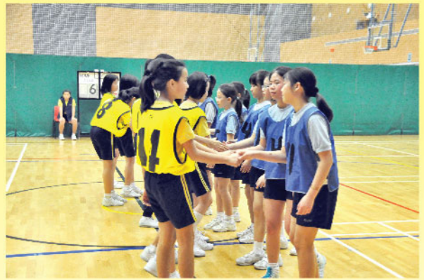
▲ 友誼第一，比賽第二