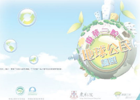
▲ 東華三院地球公民護照

「東華三院邁向綠色機構」至今舉辦了兩年，為響應活動，全校學生加入了「地球公民計畫」的行列。為實踐環保生活，學生把日常生活中各類環保行為紀錄在「東華三院地球公民護照」內。另外，培育組與常識科在四至六年級推行種植活動，教導學生認識種植原理，並將環保訊息傳播，讓學生在日常生活中建立環保習慣，邁向綠色生活。