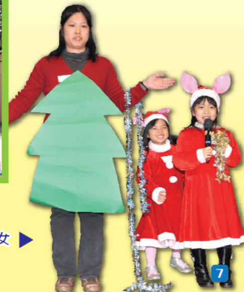
媽媽是聖誕樹，兩名女 兒為「她」裝飾