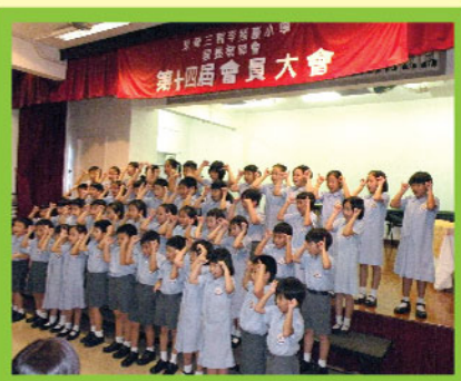
▲ 合唱團學生於會員大會 上表演，非常精彩