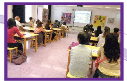
▲ 家長教育系列—家長如何善用學校網上資源指導子女學好英文

本校去年新辦了「小一家長教養孩子課程系列」，內容多元化，家長參加踴躍，一致認為有效幫助他們協助子女適應小學生活，並對學校教育有更深的認識和信心。