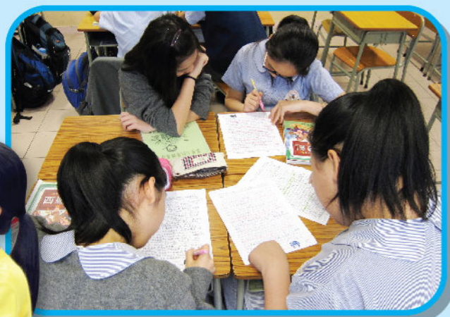
老師透過提問、思維圖像及辯論等活動激發同學的高層次思維。

課程完結後進行訪問調查，發現同學十分喜愛這種學習方法，認為不但很有挑戰性，更重要的是學會認真對待每件事。