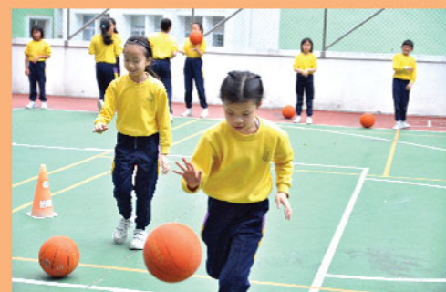
▲ 學生利用課餘時間進行籃球練習