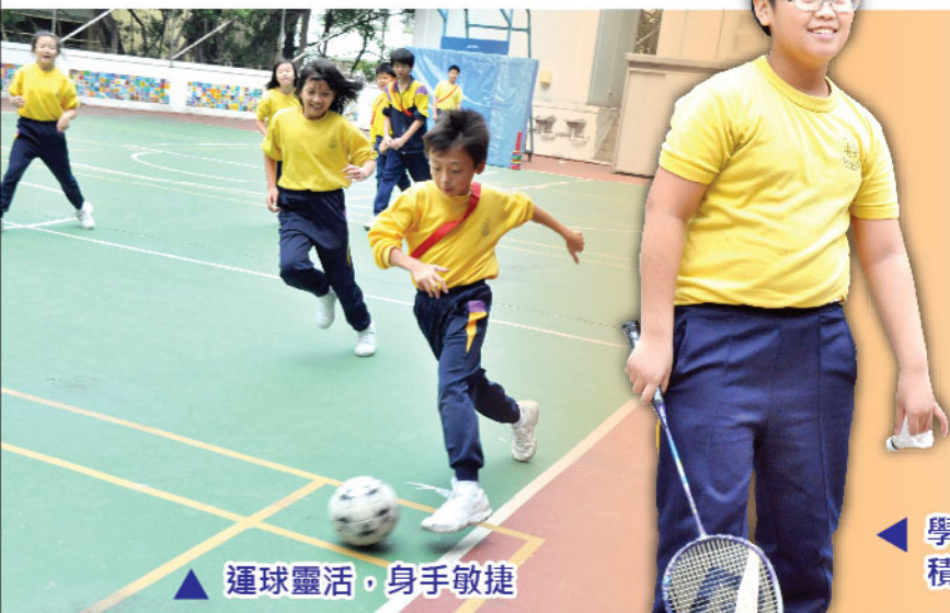
▲ 運球靈活，身手敏捷