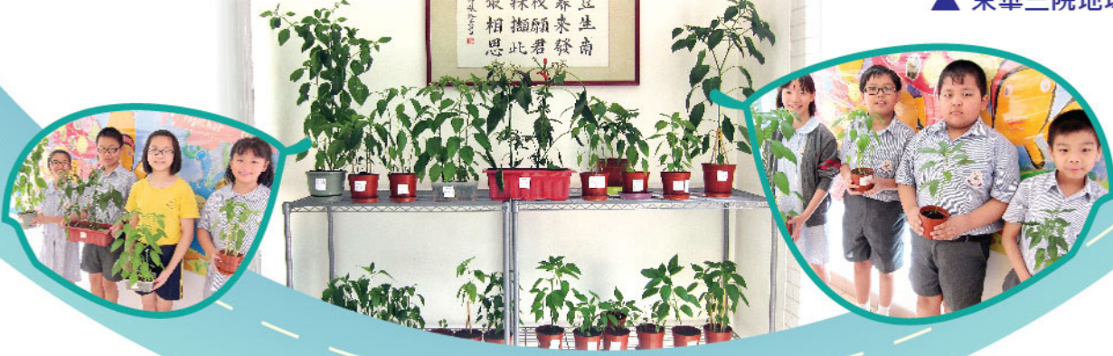
▲ 同學踴躍參與種植活動