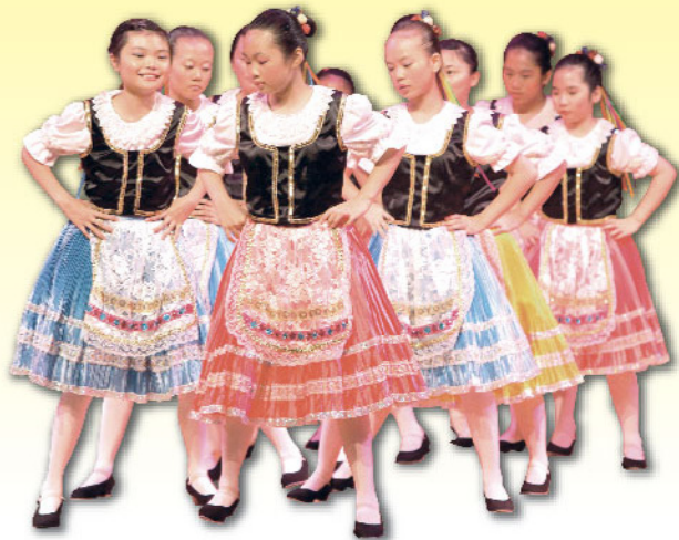
▲ 西方舞組同學舞姿美妙，於周年綜合表演會大放異彩

本校持續實施「一生一體藝」政策，期望學生能夠選擇一項體育或一項藝術項目作長期發展。根據學生課外活動紀錄，共有340位同學參與一項或以上的課外活動，佔全校學生的96%。比賽方面，本年度共有185名學生參加校外比賽，成功為學校奪得多個獎牌。