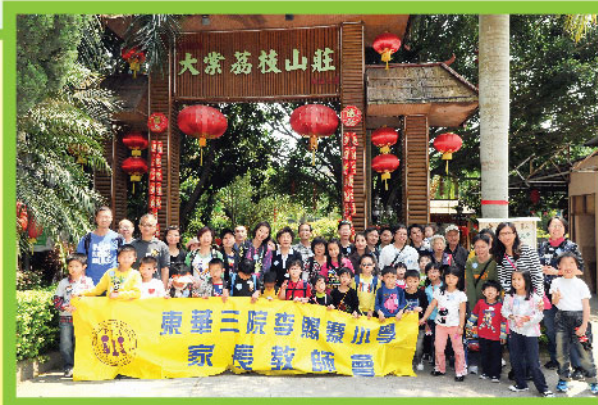
▲ 大棠荔枝山莊的合照，非常有紀念價值