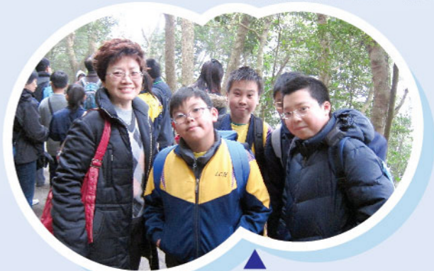
▲ 東華聯校環保遠足活動