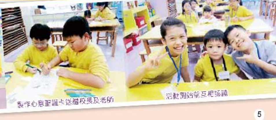
製作心意聖誕卡送贈校長及老師