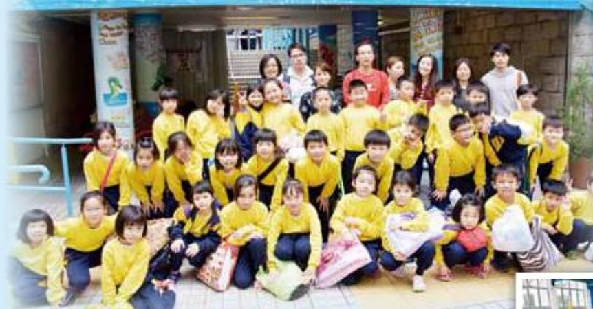
本校十分感激家長義工踴躍到場協助學生進行游泳訓練

二年級「游泳普及計畫」是本校特色課程之一，所有二年級學生於課餘內免費參加九課節之游泳訓練。學生在完成所有游泳課後，教練會為每名學生進行評估，讓家長及老師了解同學進展情況（高級(A)：游畢25米；中級(B)：游畢5米；低級(C)：持浮物踢水5米及呼吸法）。去年度整體學生成績理想，大部份家長均支持此課程，亦有近七成學生表示會繼續參與這項有益身心的運動。