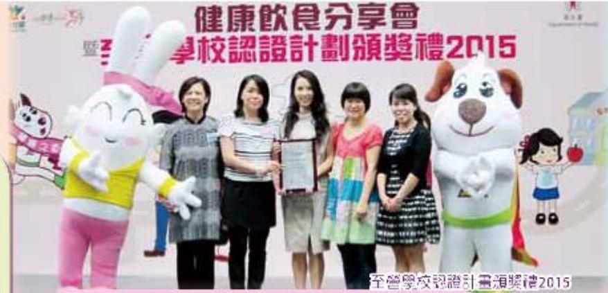
至營學校認證計畫頒獎禮2015

透過「讚賞樹」活動，張貼學生填寫的讚賞卡，鼓勵學生以正面語言表達自己的優點及欣賞別人的長處，藉此提升學生的自尊感，達致互信協作、善於表達的學校工作目標。以下簡介去年度重點發展計畫。