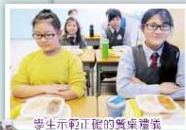
學生示範正確的餐桌禮儀