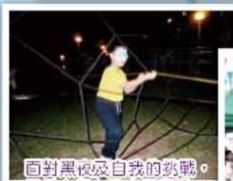
面對黑夜及自我的挑戰，提高自信心及克服困難