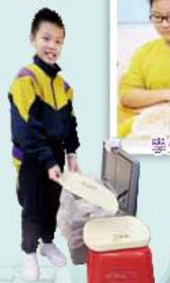
學生協助拍攝正確的餐桌禮儀短片

學生全年定期共進行四次自我檢視，自我評核在上述五大主題的表現，達致自我完善的果效。