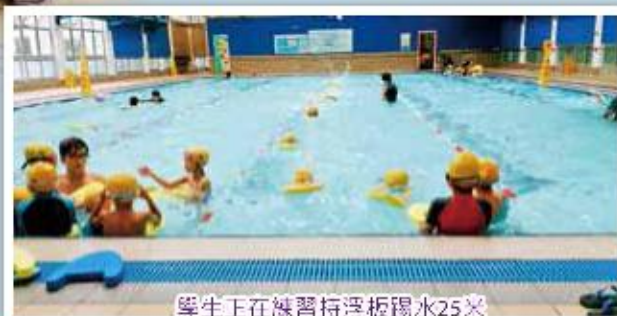
學生正在練習持浮板踢水25米