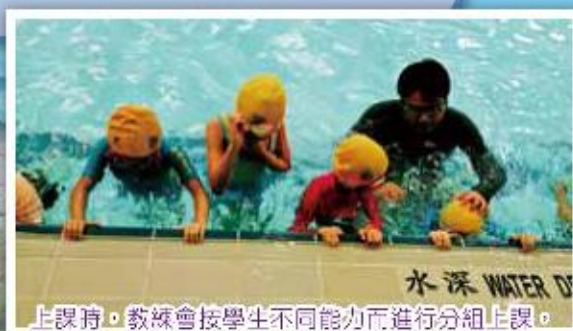
上課時，教練會按學生不同能力而進行分組上課。這組學生正練習游泳的呼吸方法