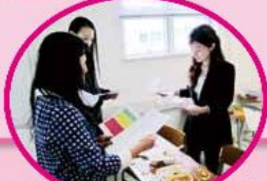
家長與衛生署職員共同檢視飯盒