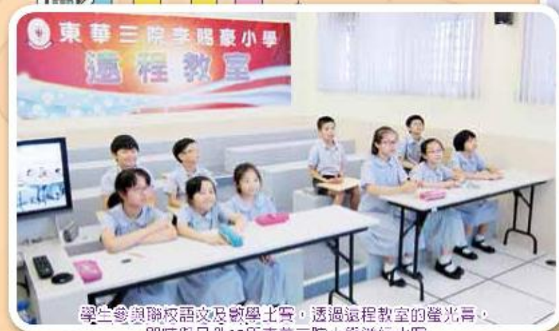
學生參與聯校語文及數學比賽，透過遠程教室的螢光幕，即時與另外12所東華三院小學進行比賽