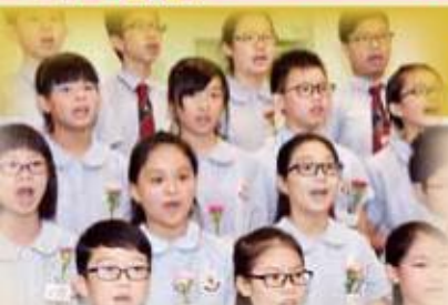
畢業同學獻唱《鳳凰花開的路口》， 表達對母校及同學的不捨和祝福

校內畢業典禮於2015年7月3日在學校禮堂舉行。當天承蒙東華三院教育科學務主任(小學)陳兆鏗先生主禮，並邀請了校董、家教會正、副主席、校友及家長出席，禮堂內不斷響起祝賀的掌聲，令人留下深刻印象。全體畢業同學透過獻唱《鳳凰花開的路口》一歌，表達對母校及同學的不捨和祝福。