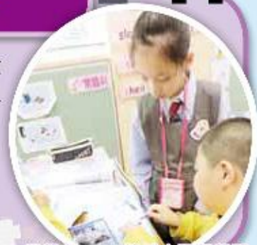
同學在LEGO機械人課程學習利用不同組件組裝電動汽車，然後透過電腦程式驅動

學生透過LEGO新一代機械人課程學習各種機械原理，包括槓桿、輪與軸、齒輪等不同組件配合，從中理解數理科學等概念。去年度，學生參加機械工程師比賽，榮獲一等獎。