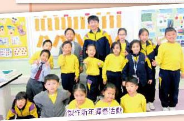
製作新年揮春活動