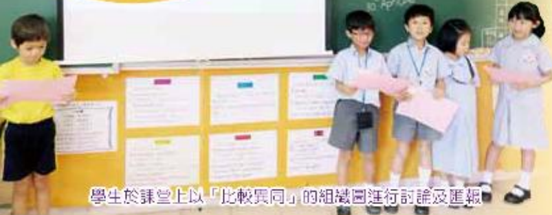
學生於課堂上以「比較異同」的組織圖進行討論及匯報

校於課程設計上強調「學習有方法」，教授學生不同的學習策略以提升學習效能。去年學校參加教育局獎優教育組的常識科資優教育教師網絡，引入「高階思維十三式」，以提升學生思維能力，讓學生對問題有多角度的理解與分析。計畫實施一年，學生能運用「高階思維十三式」的各項思維圖像整理學習內容，並能運用策略組織零碎的意念，進一步鞏固學習。根據課程問卷調查，超過八成學生認同「高階思維十三式」是一個有效的思考方法，能幫助他們學習。