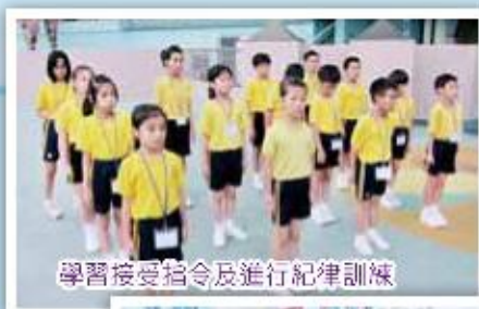
學習接受指令及進行紀律訓練

本計畫服務四至六年級共40人。此外，課程更邀請了家長及老師共同參與，以一系列的小組、歷奇活動及親子活動，建立學生的內在動力及提升家庭和學校的支援，以協助學生面對逆境及克服成長的挑戰。