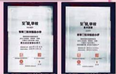
至「營」學校嘉許狀 至「營」學校基本認證

「至營學校」是一個鼓勵家庭、學校、社會合作的認證計畫，藉以建立有利於健康飲食的學習環境，培育及強化學童的良好飲食習慣。除了參加「學生健康軍團獎勵計畫」外，本校於2014-15年度成功獲得「基本認證」及「健康午餐優質認證」兩項認證，除了表揚學校健康飲食政策外，最重要的是得到全校師生、家教會、家長及午餐供應商的互相配合，使學生平日在校進食的小食及午餐都達到少油、少鹽、少糖及高纖的要求，並且多吃蔬果，少吃肉，只喝清水。為了孩子的健康體魄，期望學校每位成員都能繼續堅守健康飲食的原則。