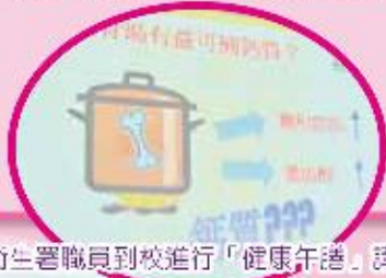
衛生署職員到校進行「健康午餐」講座