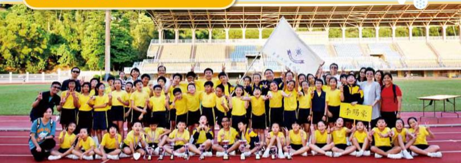
運動員在聯校運動會中，奪得多個獎項，勇奪佳績