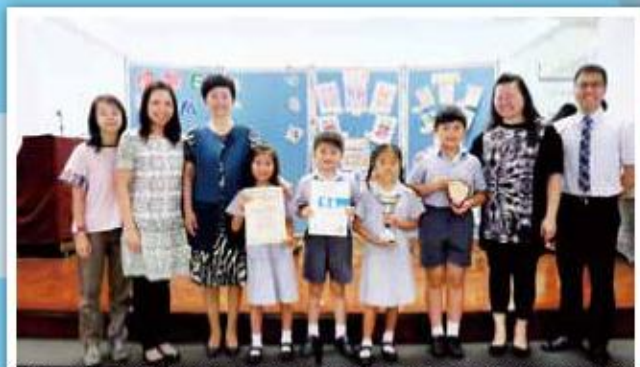
合唱團在香港校際音樂節中，榮獲聖樂教堂音樂小學合唱隊冠軍，並獲嘉遜修士紀念盃，同時亦獲得東華三院小學課外活動比賽最佳合唱成績獎