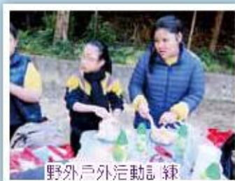
野外戶外活動訓練