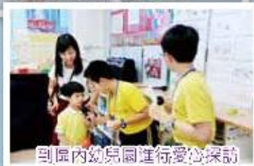
到區內幼兒園進行愛心探訪