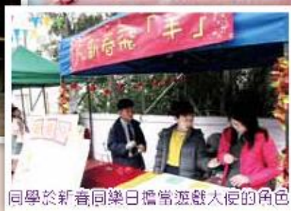
同學於新春同樂日擔當遊戲大使的角色