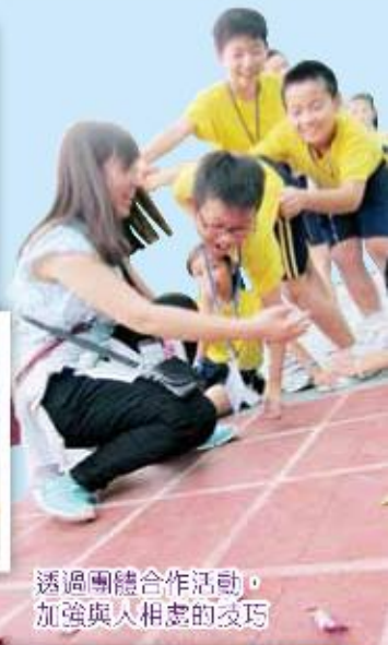
透過團體合作活動，加強與人相處的技巧