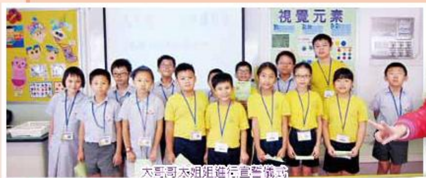
大哥哥大姐姐進行宣誓儀式

我們希望透過喜閱寫意的教材，由四至六年級的大哥哥大姐姐教導一年級同學認讀中文生字、短句及篇章，提高他們的認字能力及學習中文的興趣。