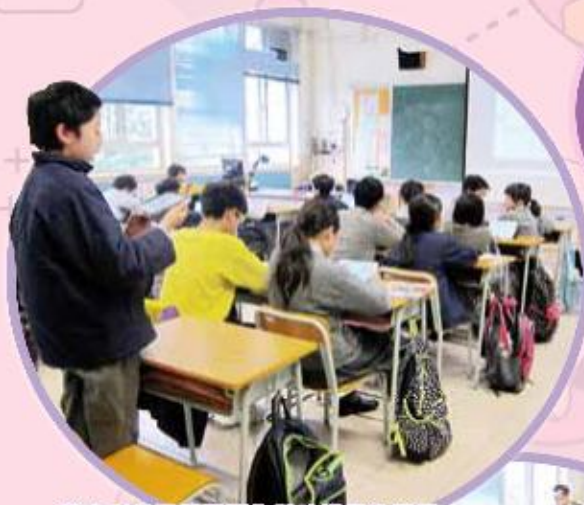
學生利用平板電腦作即時構思及匯報

為 裝備學生迎接日新月異的學習模式，推行電子學習是學校未來的重點發展。本校在去年已在課堂嘗試利用網上學習平台「Office 365」作「翻轉課堂」(Flipped Classroom)的學習方法，讓學生透過網上教材預先備課，再在課堂上利用平板電腦進行討論或小測，讓教師作即時回饋。此外，學生預先錄影習作，然後在課堂上以平板電腦匯報，有助提升表達信心、學習動機及全班參與度。