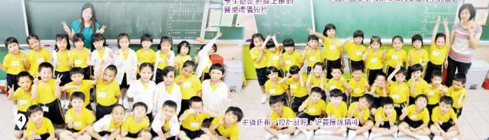
拍攝班相、設計班呼，培養團隊精神