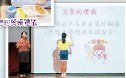
承諾日，學生代表帶領同學進行承諾宣言