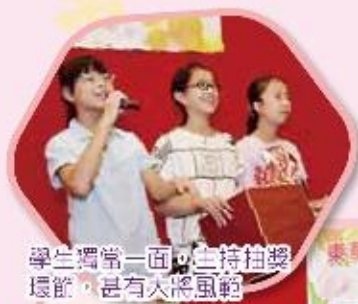
學生獨當一面，主持拍獎 環節，甚有大將風範