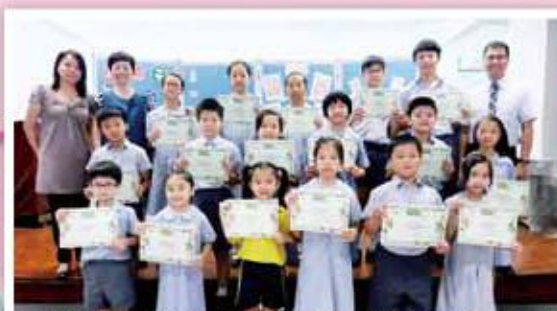
表揚學生每日吃水果，各級代表接受「開心水果月」獎狀