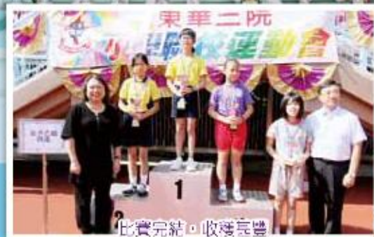
比賽完結，收穫良豐