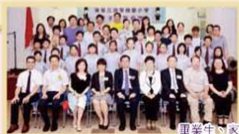
畢業生、家長與嘉賓合照