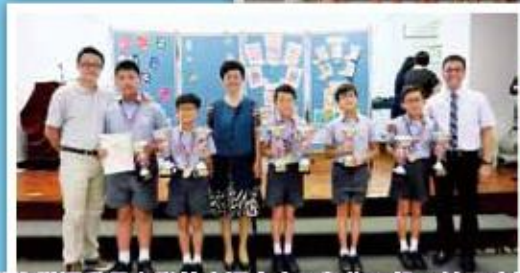
游泳隊運動員在聯校水運會中，凱旋而歸，並成功打破多項大會紀錄