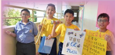
傑出學生選舉單元培養學生的公民意識