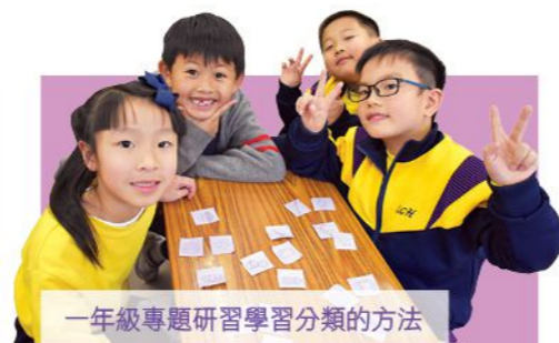
一年級專題研習學習分類的方法