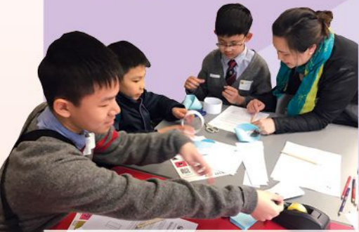
參加The Julia Robinson Mathematics Festival in Hong Kong