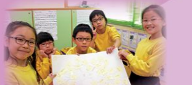
三年級專題研習腦圖製作