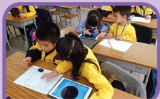
滲入電子教學元素，加強課堂互動