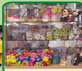
獎品櫃展示豐富的禮品