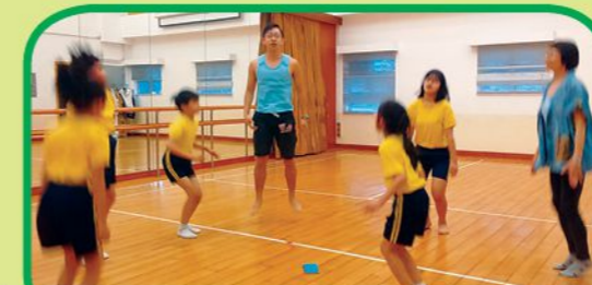
參加者透過舞蹈抒發情緒，同時學習留意別人的身體語言，參加者於活動後總結經驗，分享學習成果。