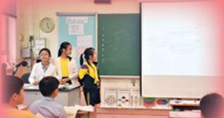
學生課堂匯報，提升自信