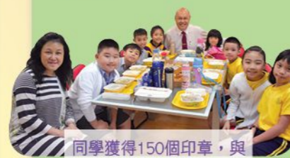
同學獲得150個印章，與校長共進午餐

「積極孩子獎勵計劃」鼓勵學生設訂目標，持之以恆，養成良好的行為習慣，成為主動積極的孩子。