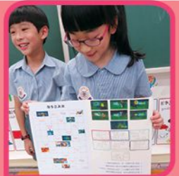
透過自製遊戲訓練創意及口語表達能力