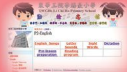
學生透過內聯網進行預習及自學