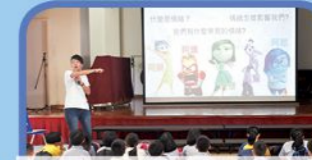
情緒主人翁 - 情緒教育講座