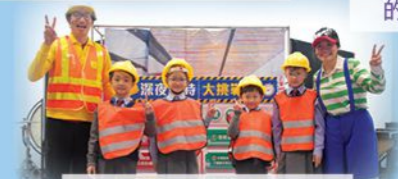
鐵路安全達人 - 教育劇場