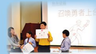
愛·回家 - 品德教育講座