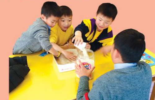
學生利用「米盤」，運用觸覺溫習中文默書