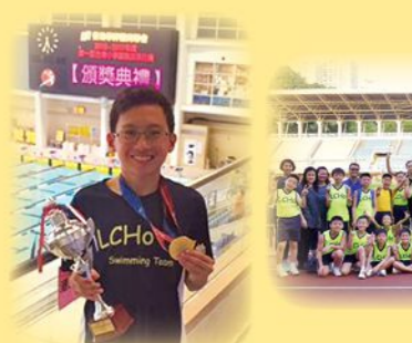
同學獲得全港小學區際游泳比賽殊榮