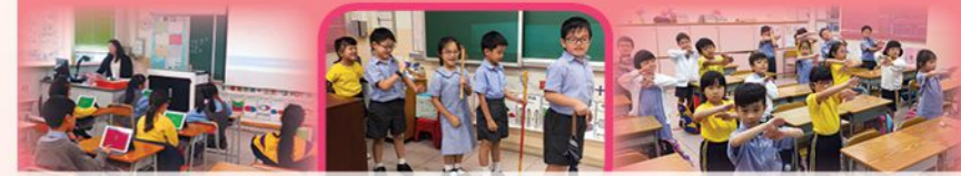
透過電子教學進行學習，學生投入度達百分之百 一年級學生透過話劇演繹《西遊記》情節 一年級「喜閱寫意」課程，以動作識別中文字組合