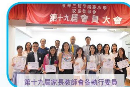
第十九屆家長教師會各執行委員

孩子能健康成長有賴家校之間緊密的合作，為了與家長有良好的溝通，除了鼓勵家長參與家長教師會及家長義工外，家長教師會每年更為家長舉辦各類型活動，例如專題講座、親子聖誕聯歡會、親子旅行等。還邀請校外幼稚園及小學家長一同參與講座，互相交流教育子女心得。此外，透過一系列家長講座及家長學堂等活動，全面支援家長在家教育孩子的需要。