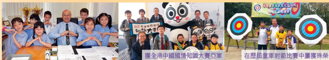
獲全港中國國情知識大賽亞軍