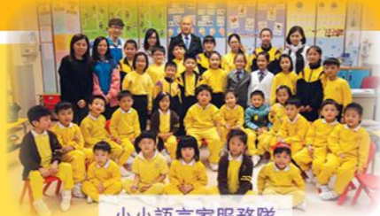
小小語言家服務隊