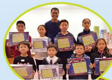
得到聖誕大獎小朋友最開心