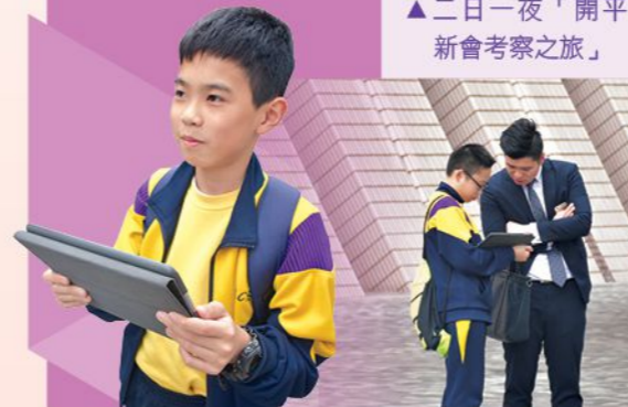
▲綜合課專題研習，同學利用平板電腦進行戶外訪問蒐集一手資料

除上述多元化活動外，為促進學習，本校會推薦學生參加不同性質的國際公開試，包括：劍橋小學英語考試、澳洲新南威爾斯大學主辦的國際聯校學科數學科及科學科評估及比賽、港澳地區中小學普通話水平測試等，讓學生的學術水平獲得肯定。