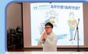
MQ小精靈 - 品德教育及預防違法行為講座