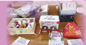
三年級最佳護蛋日誌及裝置設計