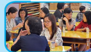
參加者彼此分享教養子女心得