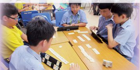
魔力橋數字牌遊戲培養數感，提升思考能力