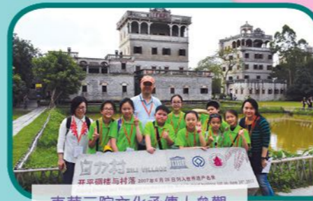
東華三院文化承傳人參觀開平碉樓