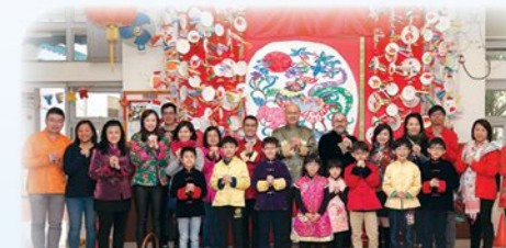
師生及家長於新春節慶服裝日穿着中國傳統服裝上學