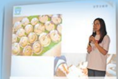
「貧窮書院 - 學生的一天」講座