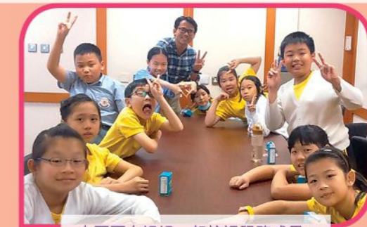
大哥哥大姐姐一起檢視服務成果，以培養服務他人的精神