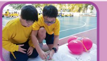
不碎的雞蛋單元培養學生的科探精神