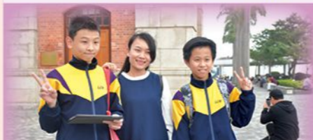
戶外訪問市民及遊客以收集第一手數據