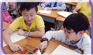
探究數學與日常生活的聯繫