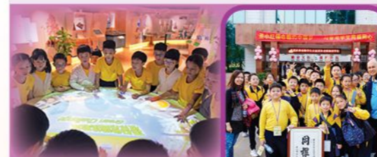
▲常識科參觀活動，學生到校外進行全方位學習