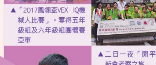
▲二日一夜「開平新會考察之旅」