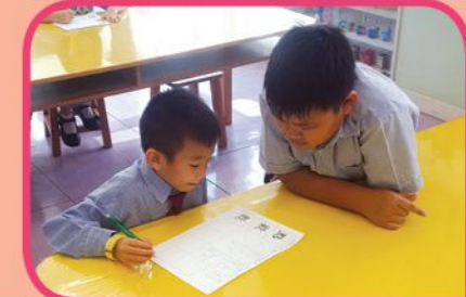
大哥哥大姐姐於午息時間耐心教導小一學生學習中文字結構