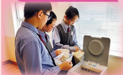
參與「齊惜福」廚餘回收及種植計劃，培養學生「惜食」及「環保」的態度