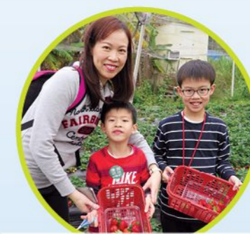
在有機士多啤梨園親手採摘士多啤梨