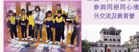
▲「2017鳳翎盃VEX IQ機械人比賽」，奪得五年級組及六年級組團體賽亞軍