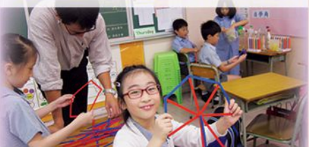
「自學角」鼓勵學生於課餘自主探索