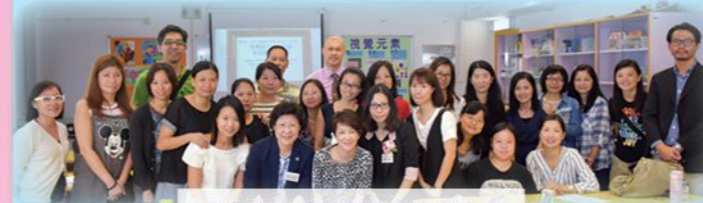
參加者完成計劃後與嘉賓合照

課程由教育心理學家、各科科主任及東華三院學生輔導服務督導主任等主持，主題包括：培養親子關係、提升孩子專注力、學習中、英、數方法等，發揮家校合作精神，讓孩子健康成長。