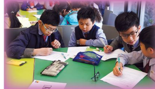
The Julia Robinson Mathematics Festival in Hong Kong 2017，發展學生解難及思維能力